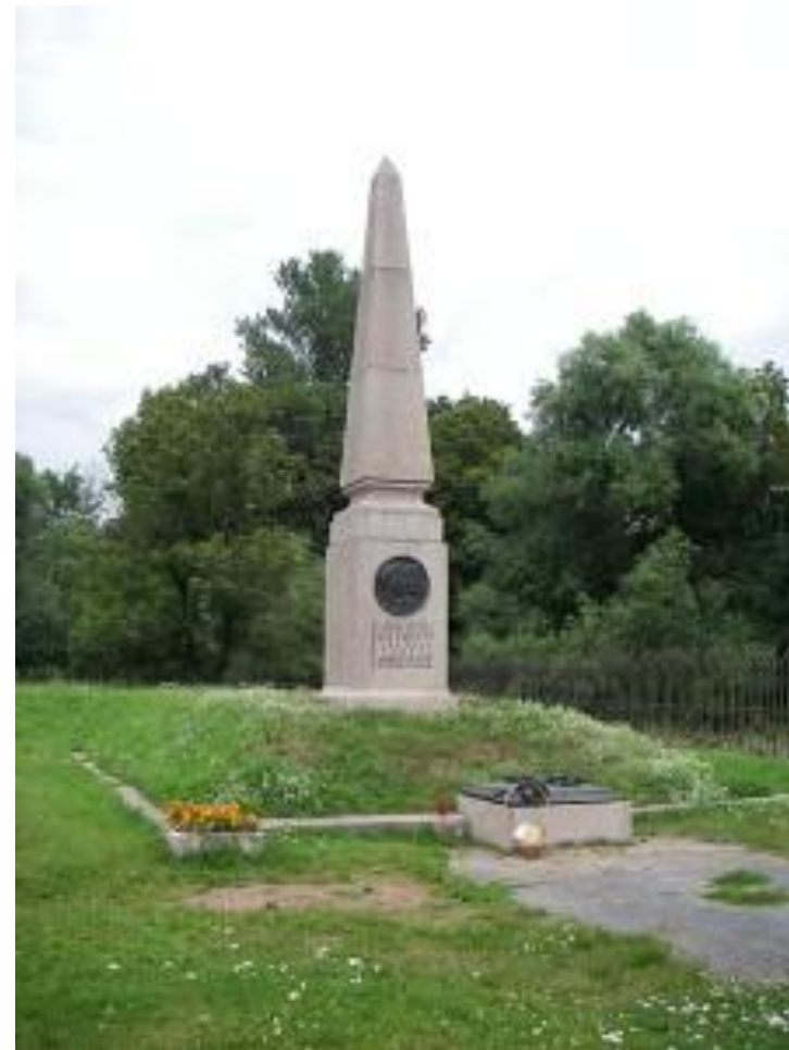
Памятник декабристам на месте их казни в Петропавловской крепости