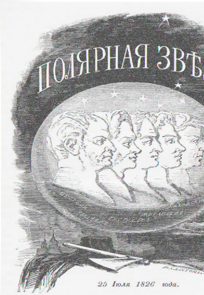
Профили пяти казнённых декабристов на обложке альманаха «Полярная звезда»