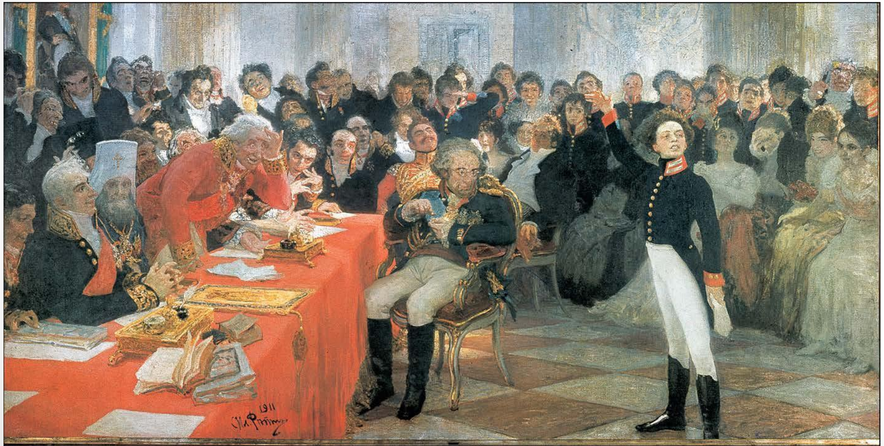
И.Е. Репин. Пушкин на лицейском экзамене. 1911