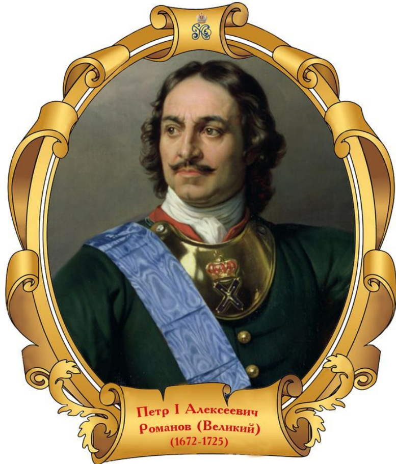
Петр I Алексеевич Романов (Великий) (1672-1725)

Петр I реформатор Руси. Не обошли они и календарь. В декабре 1699 года император издаёт указ о том, что с 1 января 1700 года Новый год в России будет отмечаться 1 января. Петр повелел "учинить некоторые украшения от древ и ветвей сосновых, елевых и можжевеловых", потешаться с огнем - разжигание новогодних костров, учинять стрельбу и гуляния. Царским указом предписывалось поздравлять друг друга с праздником. И теперь гражданский новый год праздновали в начале января