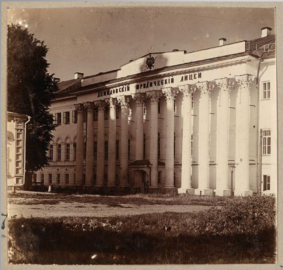
Демидовский юридический лицей. Ярославль.