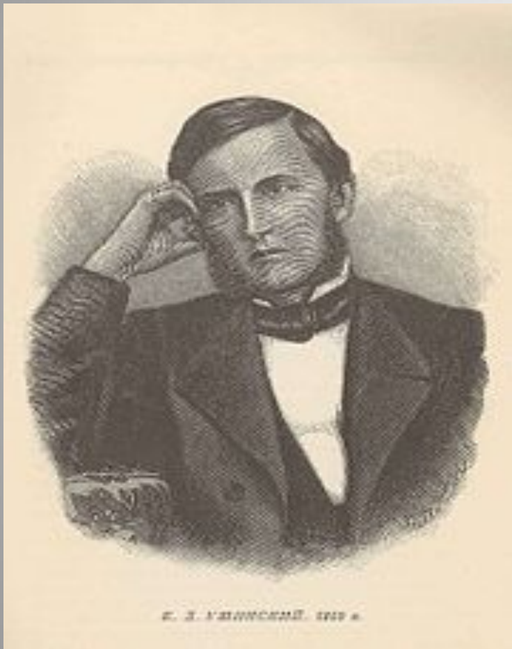
К.Д. Ушинский в 1859 г.