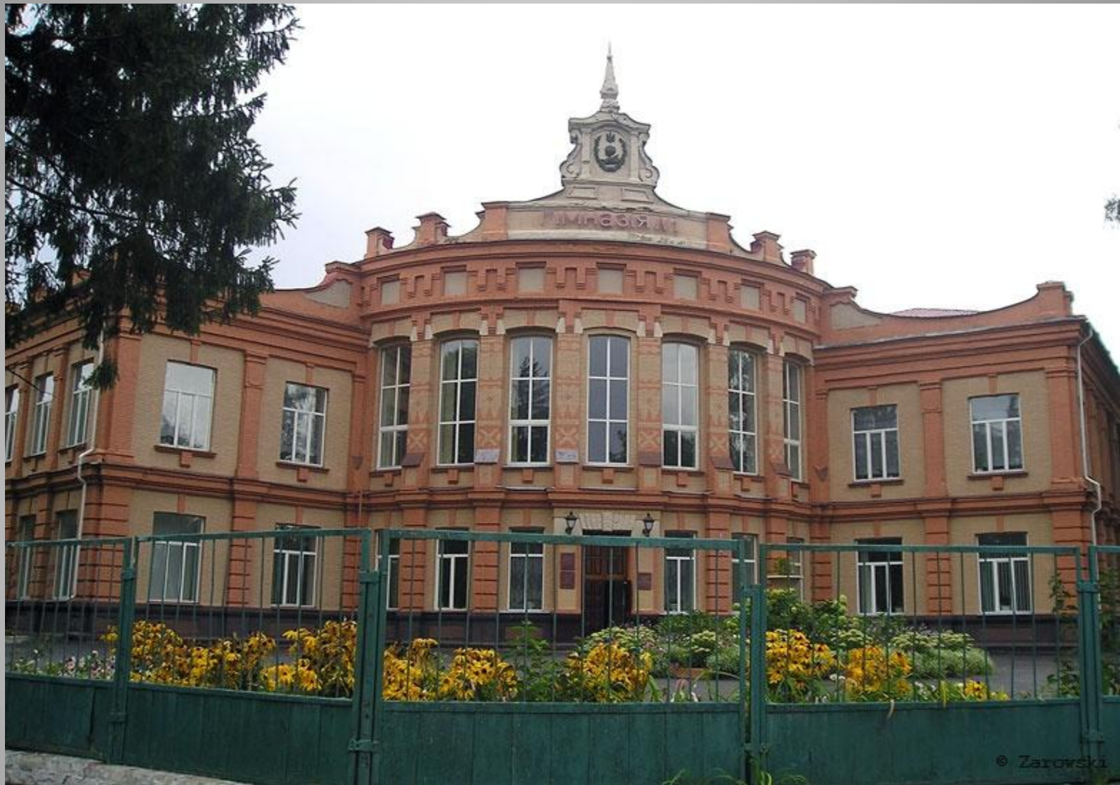
Гимназия в г. Новгороде-Северском (осн. в 1804 г.), где учился К.Д. Ушинский.