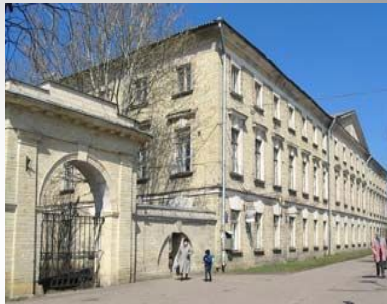
Здание Гатчинского Сиротского института