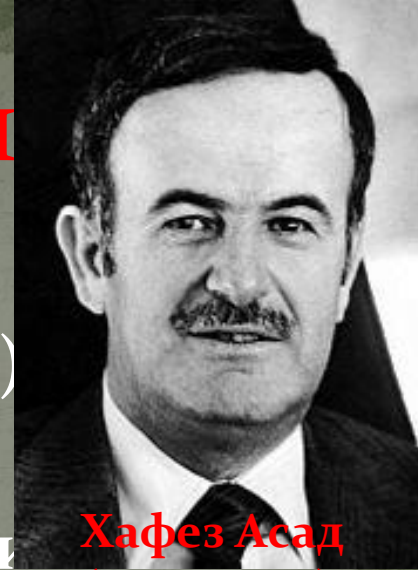
Хафез Асад (1930-2000)