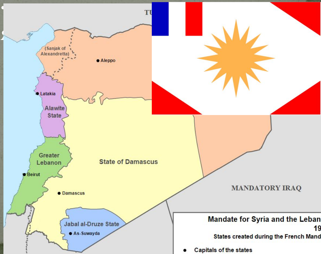
Mandate for Syria and the Lebanon 19 States created during the French Mandate ● Capitals of the states