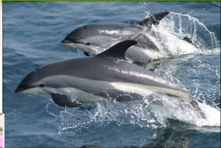
Атлантический белобочий дельфин Снежный барс