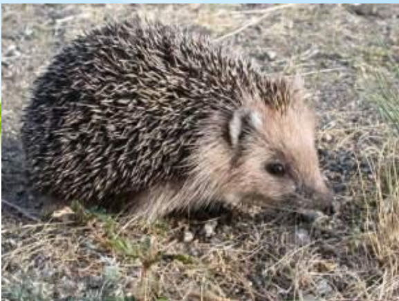
Даурский еж Цикламен первоцветный