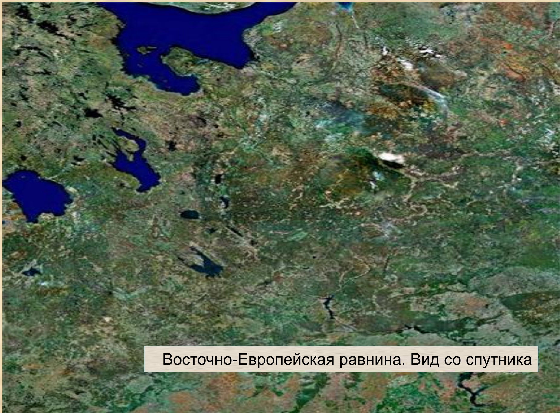
Восточно-Европейская равнина. Вид со спутника