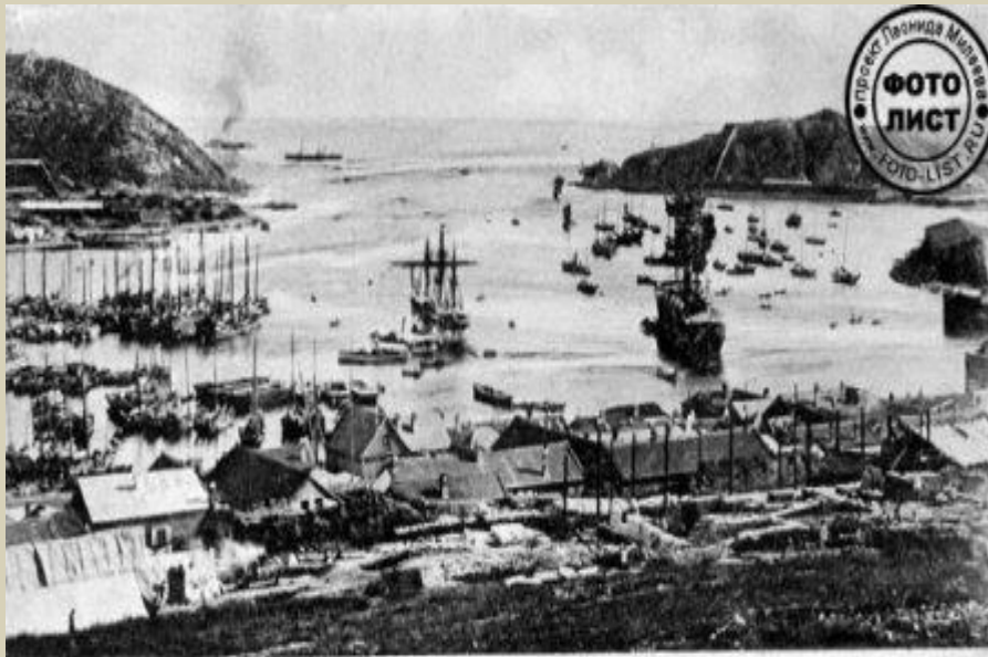
Вход в Порт-Артур. Entrée à Port-Arthur. № 4.

В 1898 г. Россия получила в аренду у Китая часть Ляодунского полуострова с Порт-Артуром и Далянем (Дальним) .