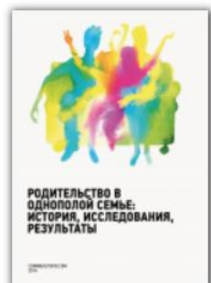
[2014] Родительство в однополной семье