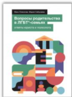
[2019] Вопросы родительства в ЛГБТ*-семьях