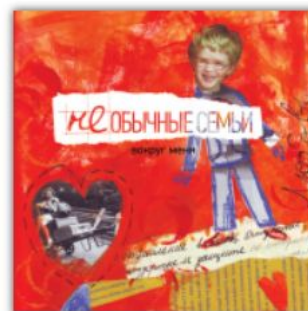
[2012] (Не)обычные семьи вокруг меня