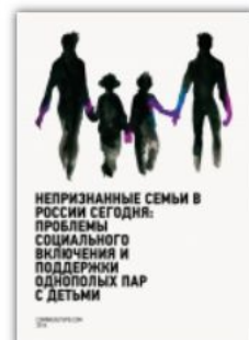
[2014] Непризнанные семьи в России сегодня