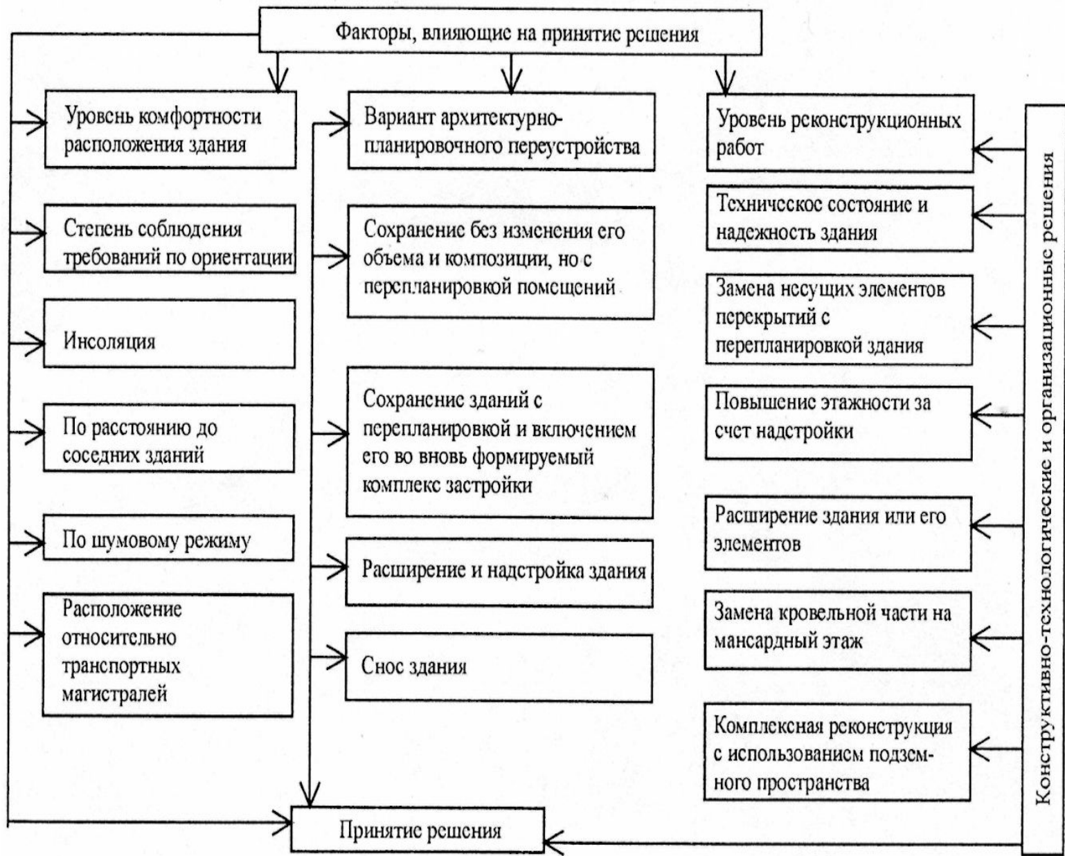
Факторы, влияющие на принятие решения по реконструкции отдельно взятого объекта