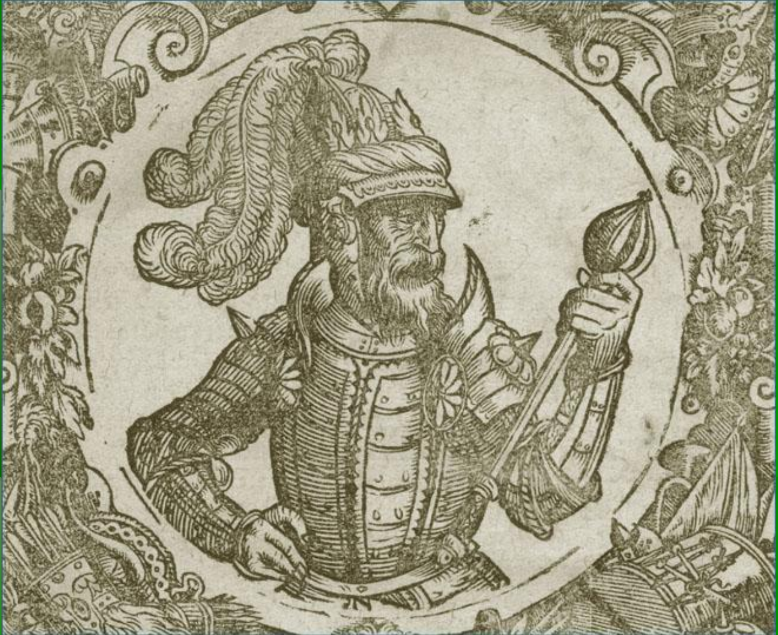
Ольгерд – сын Гедимина и русской княжны Ольги.