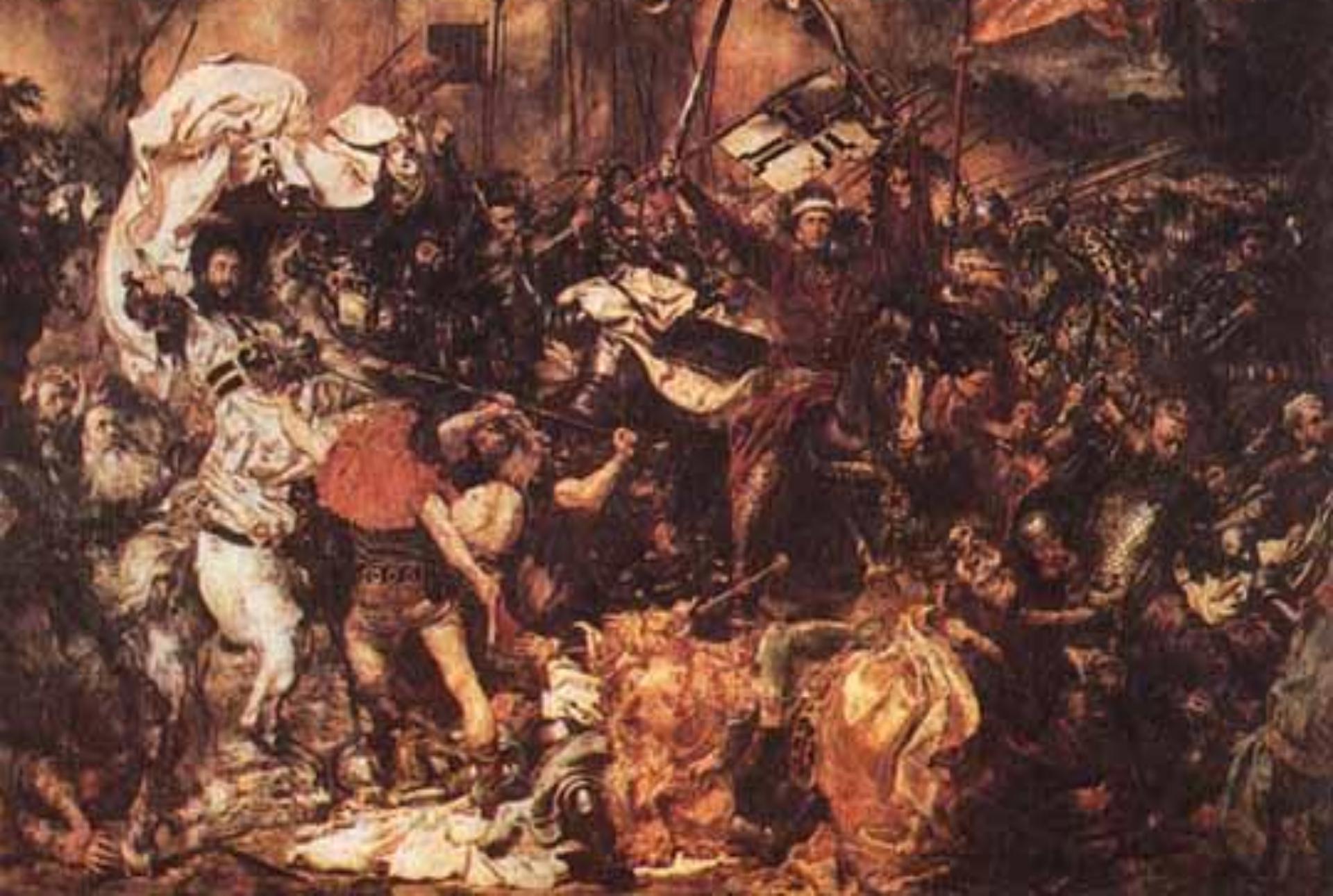
Грюнвальдская битва Я.Матейко.