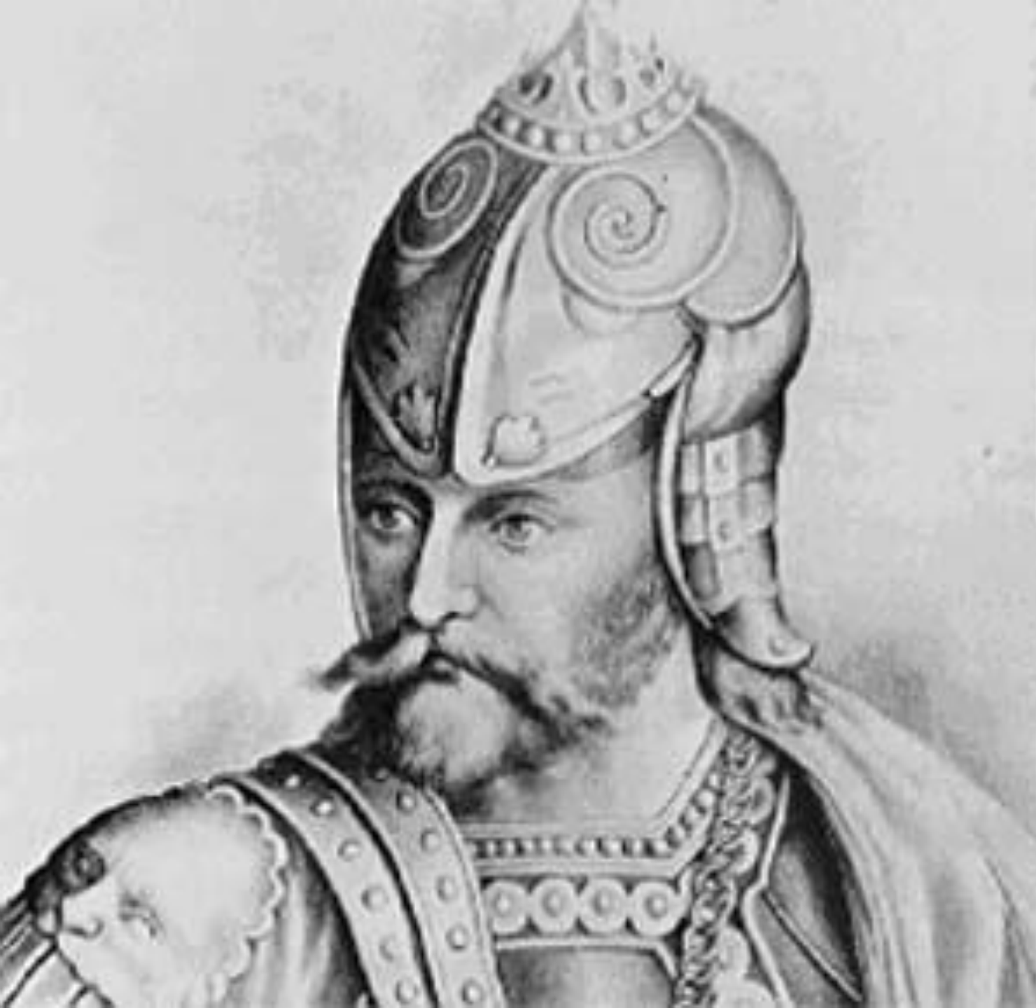
Гедимин 1275-1341гг. 1315-1341гг.