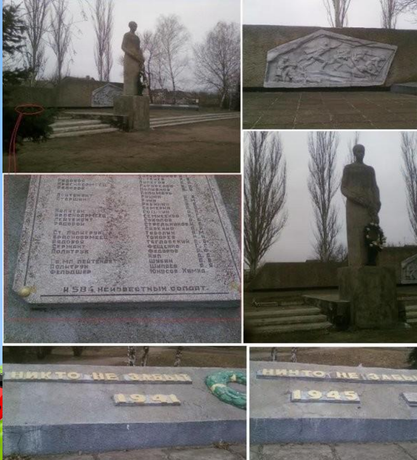
с. Мирная Долина, Донецкая область