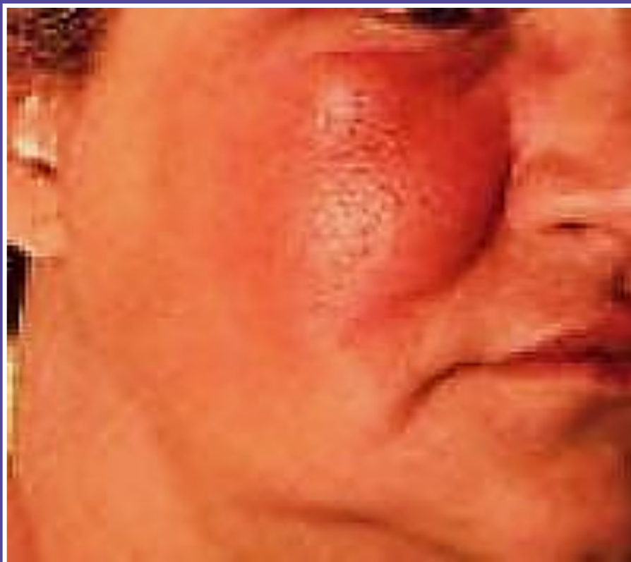
Рожа лицевой области