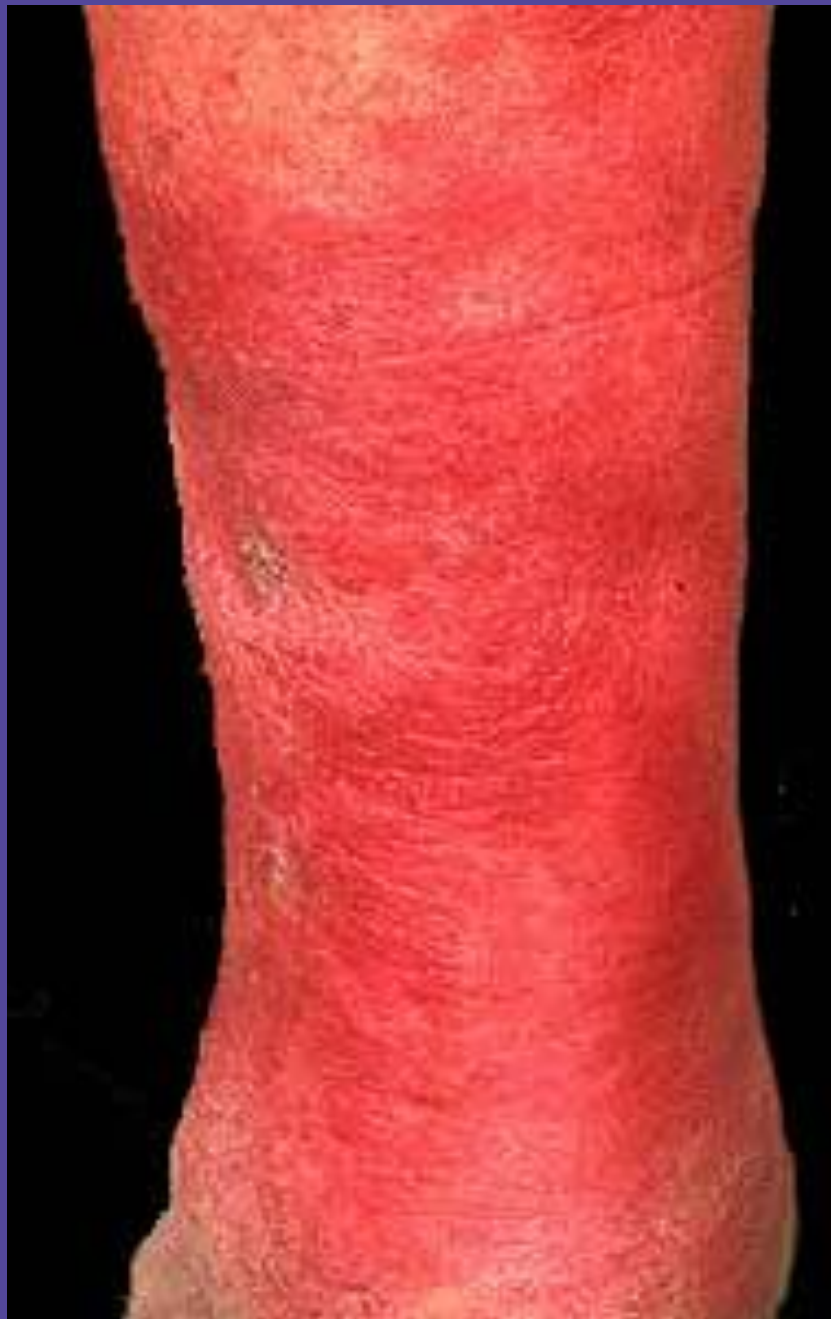
Рожа передней поверхности голени