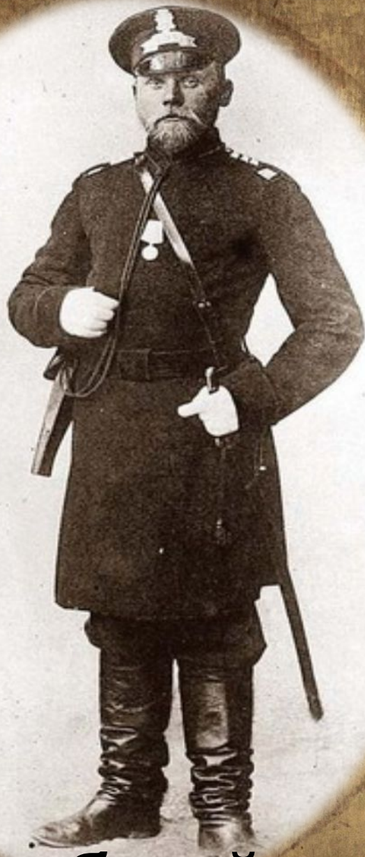
Судебный пристав (19 век)

В ходе судебной реформы 1864 г. институт судебных приставов был восстановлен в качестве неотъемлемого структурного подразделения суда. 20 ноября 1864 года императором Александром II были утверждены «Учреждение судебных установлений», «Устав о наказаниях, налагаемых мировым судьей», «Устав уголовного производства», «Устав гражданского производства». Судебные уставы определили новые