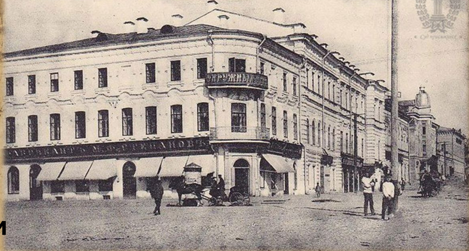
Симбирскъ. Окружный судъ и Дворцовая улица.

Фактически же реформа началась задолго до указанной даты. Она коснулась не только судов, но и других взаимодействующих с судами органов. Она также выразилась в крайне запоздалом учреждении