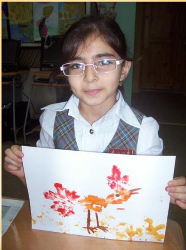
Рисунок готов. Творческих вам успехов!