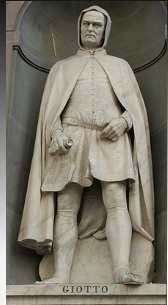
Статуя Джотто в нише пилона Флоренция,