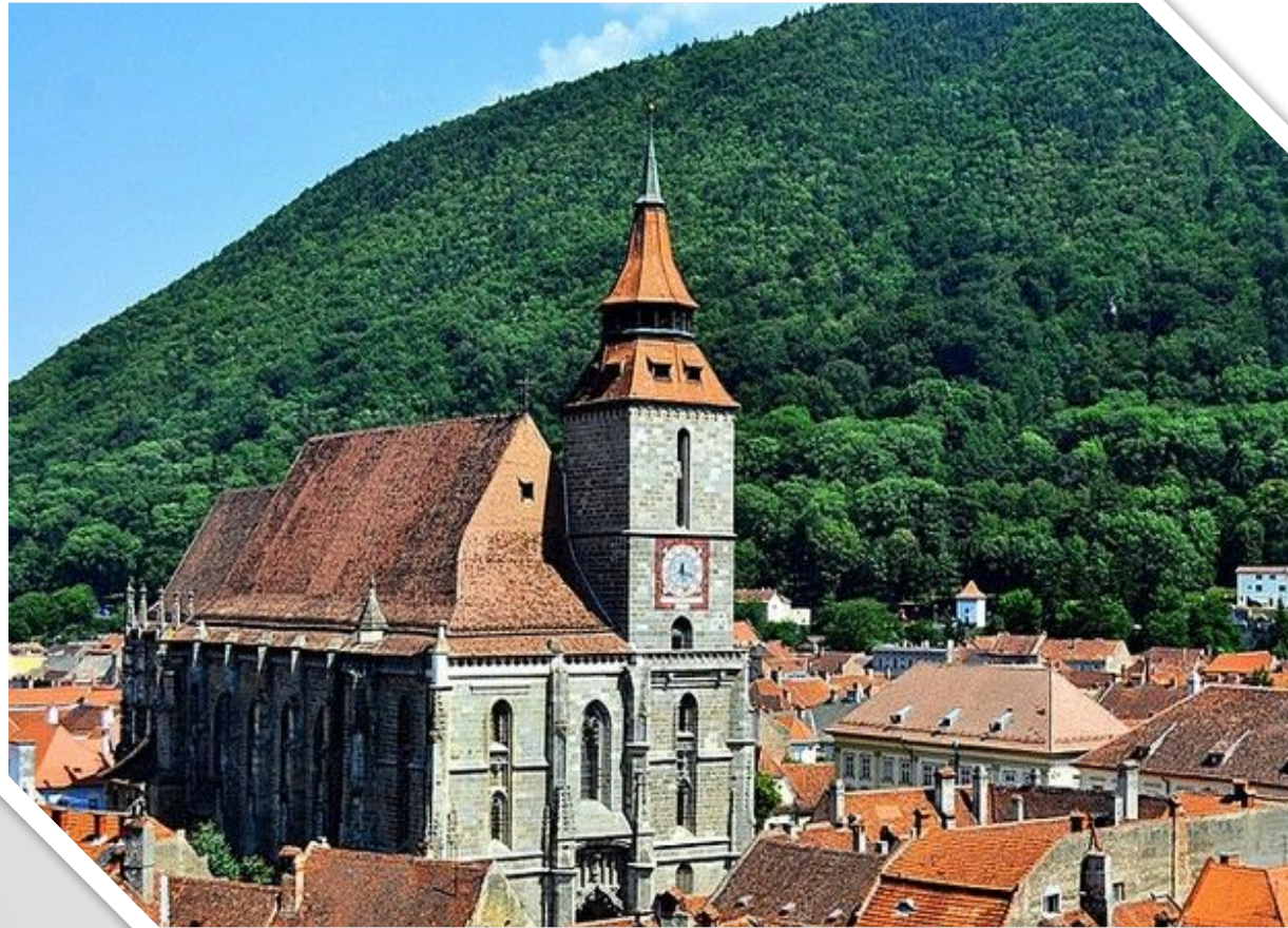
ЧЁРНАЯ ЦЕРКОВЬ (БРАШОВ)