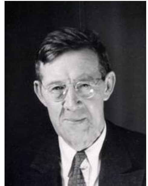
Питирим Сорокин (1889-1968)