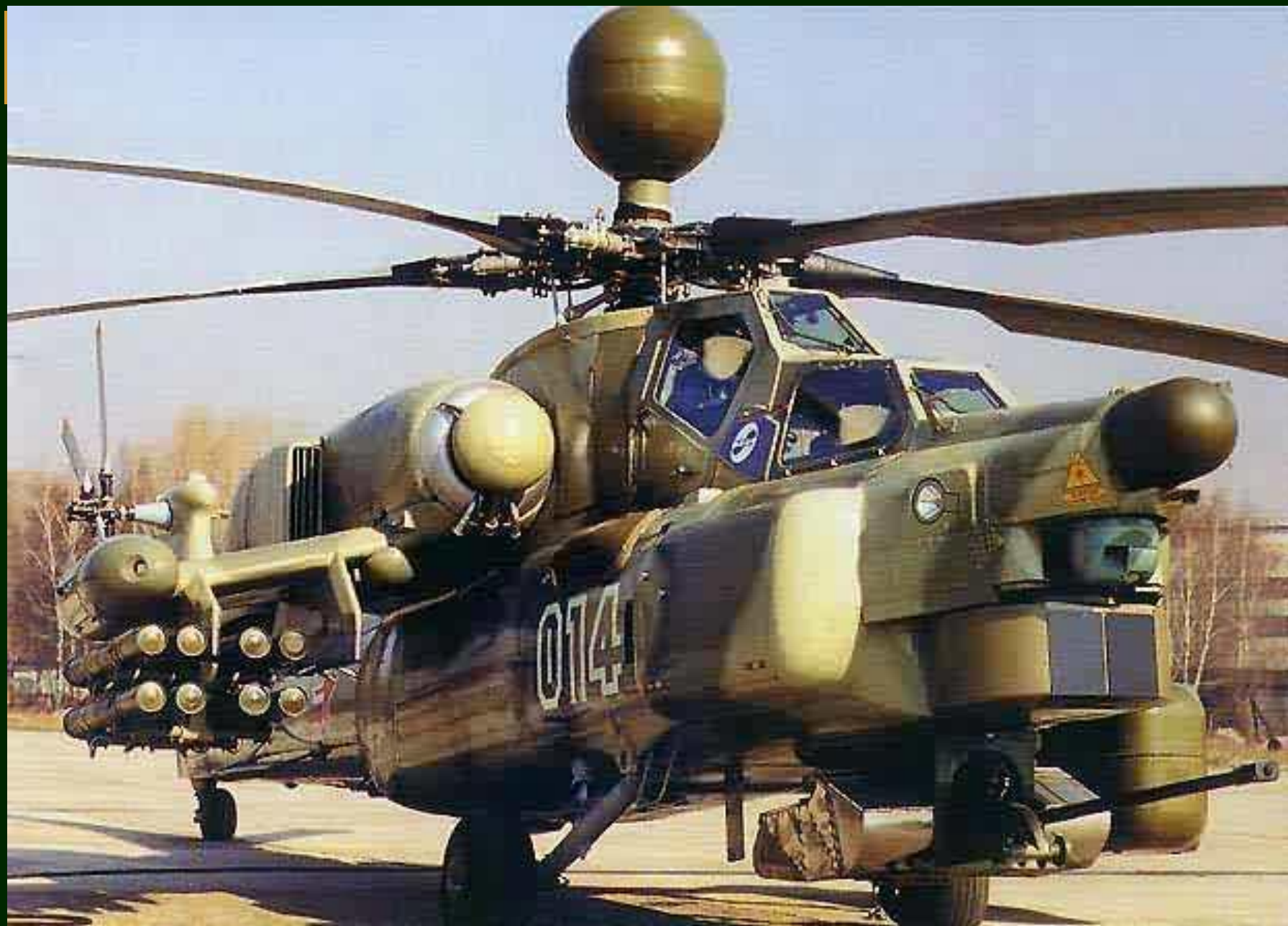
Вертолет боевой поддержки Ми-28