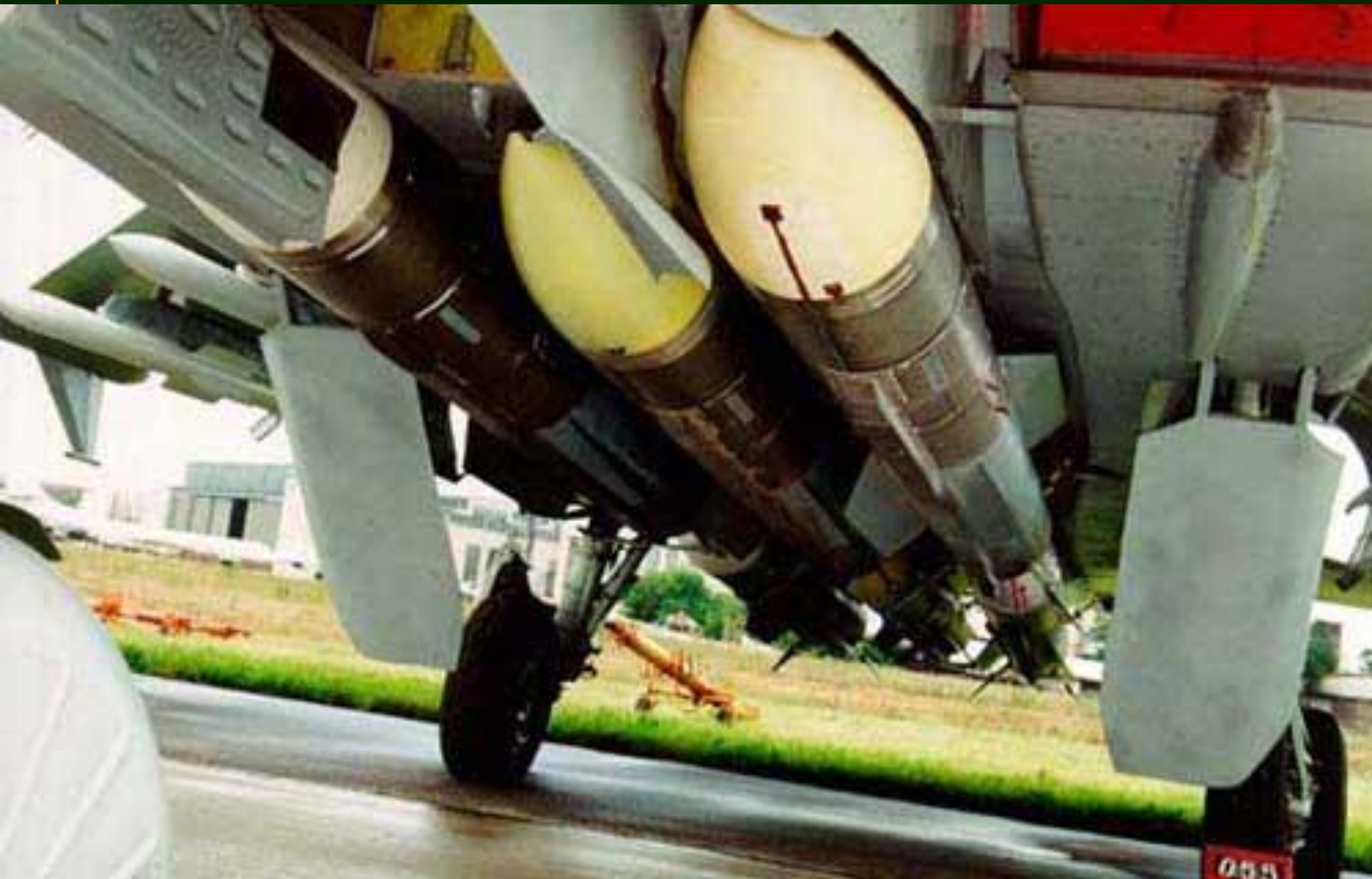
Управляемая баллистическая ракета большой дальности