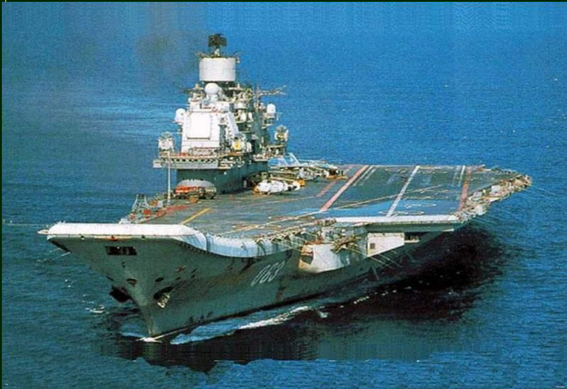
Авианесущий крейсер «Адмирал Кузнецов»