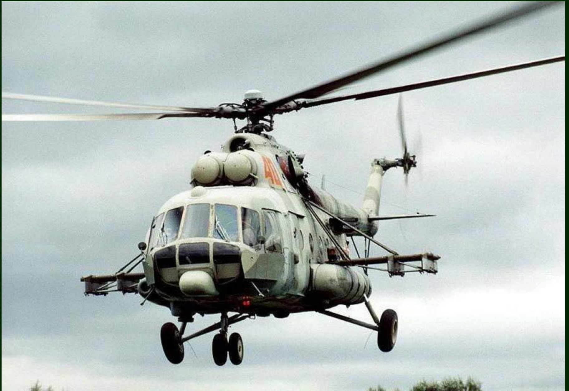
Вертолет Ми - 8