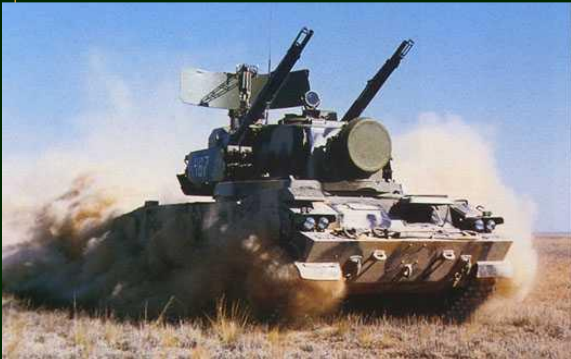
Танковая зенитная установка