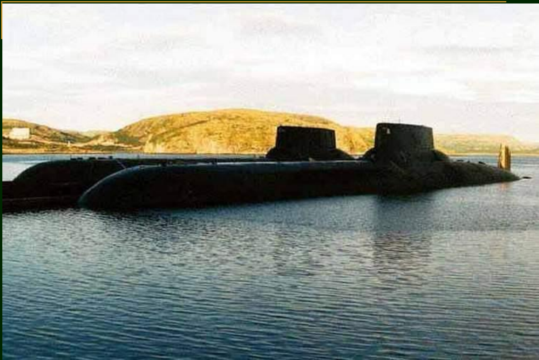
Атомные подводные крейсера «Акулы».