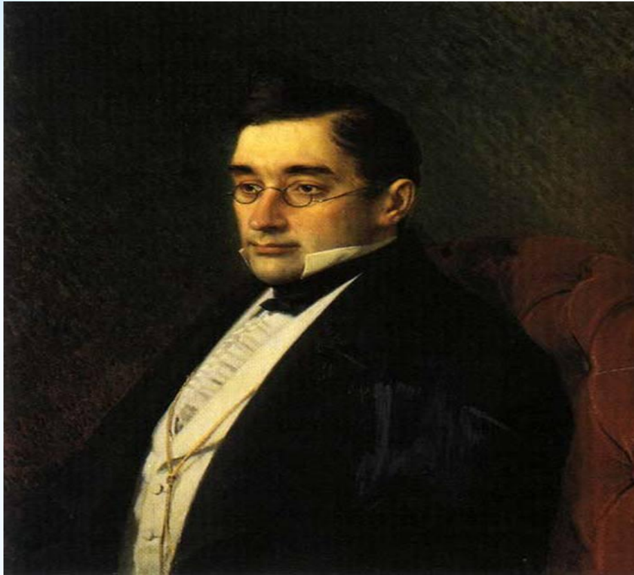
* Александр Сергеевич Грибоедов