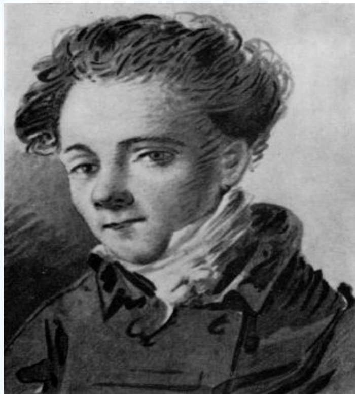
* Антон Дельви́г