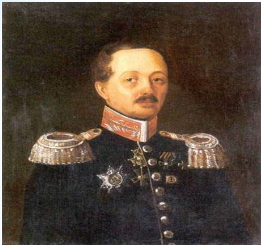
* Евгений Абрамович Баратынский