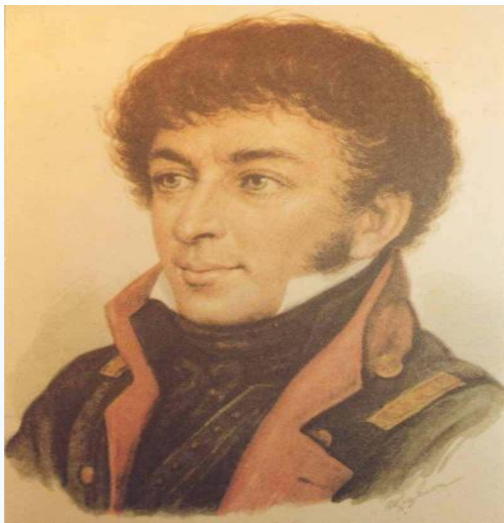
* Вильгельм Кюхельбекер