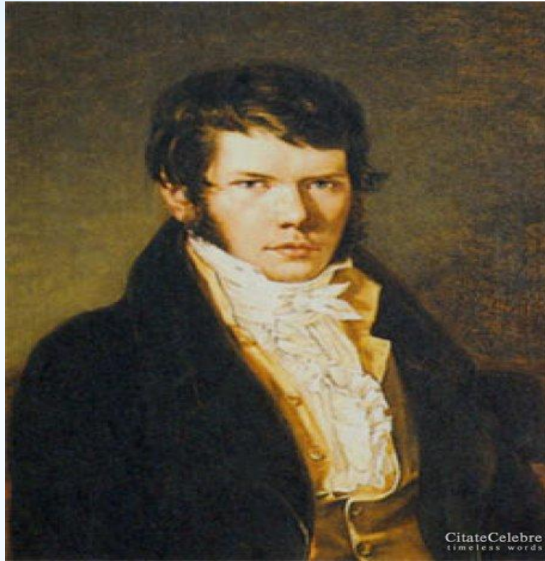
* Пётр Андреевич Вяземский