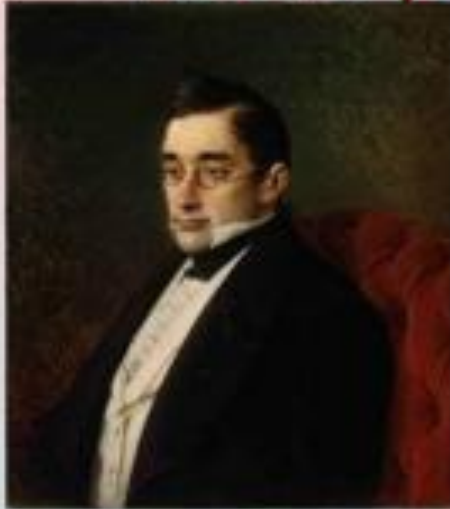
Портрет работы И. Крамского. 1873

Грибоедов принадлежит к самым могучим проявлениям русского духа.