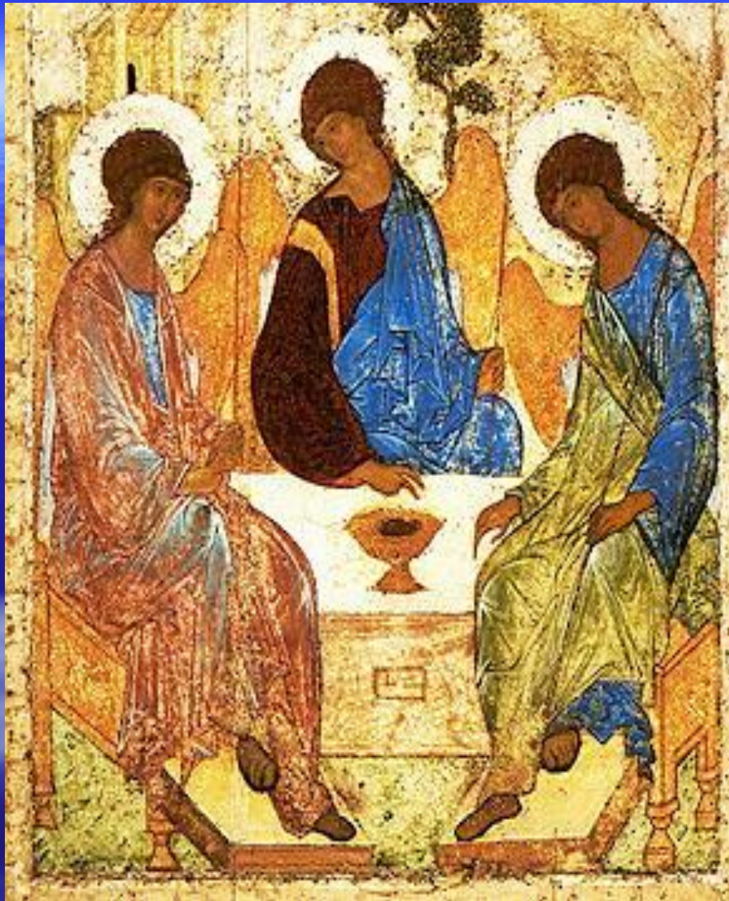
«Троица» Андрей Рублев