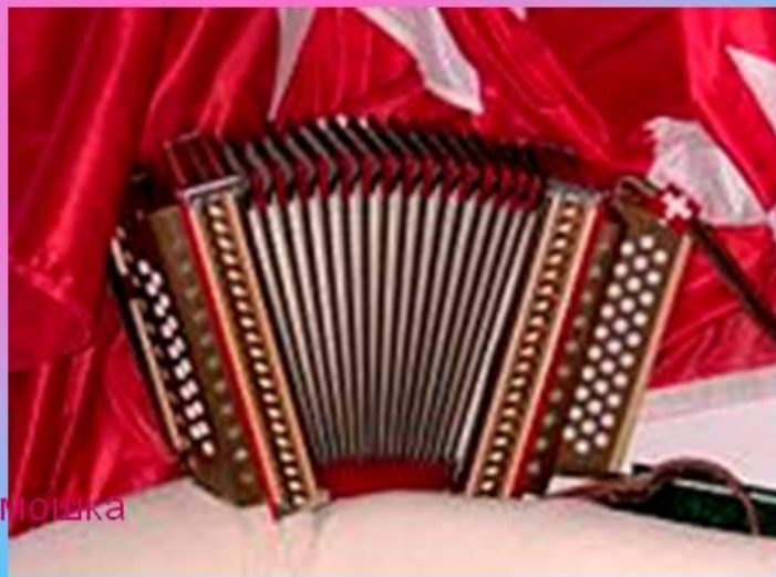
Гармóнь (гармоника, гармошка)

Гармóнь (гармоника, гармошка) — язычковый клавишно-пневматический музыкальный инструмент с мехами и двумя кнопочными клавиатурами. Левая клавиатура предназначена для аккомпанемента: при нажатии одной кнопки звучит бас или целый аккорд. На правой клавиатуре играется мелодия.