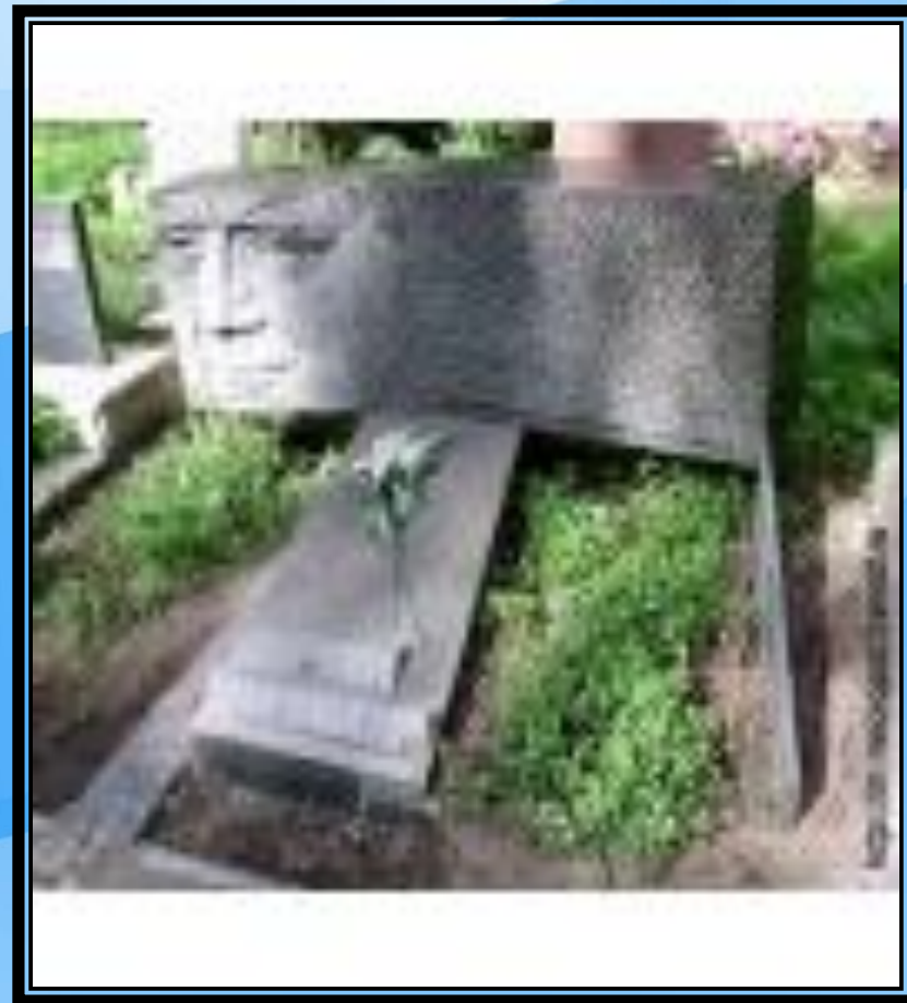
Могила Юрия Визбора на Новокунцевском кладбище

1999 г. – двухтомник стихов, песен и прозы, компакт-диски.