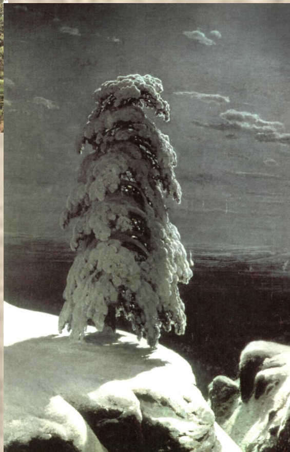
И.И.Шишкин «На севере диком...»