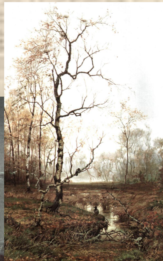
Ефим Волков «В лесу. По весне.»