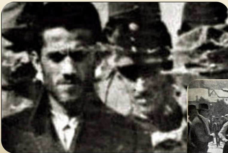
сербский террорист Гаврило Принцип

Поводом к 1 мировой войне послужило убийство членом террористической организации «Молодая Босния» наследника австро-венгерского престола эрцгерцога Франца Фердинанда.