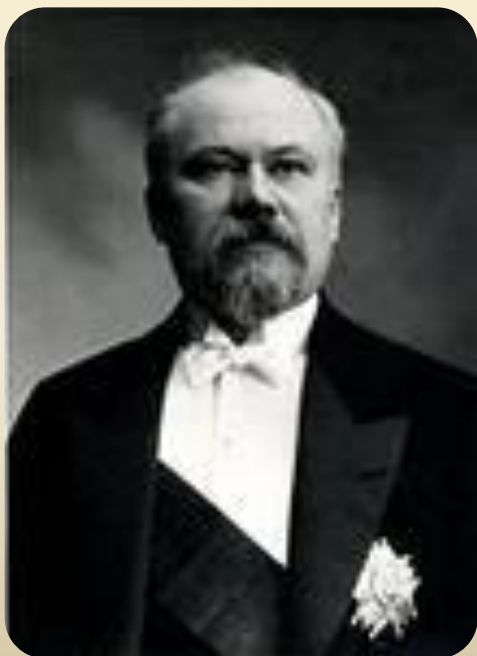
Президент Франции Раймон Пуанкаре

3 августа (21 июля по ст. ст.) Германия объявила войну Франции