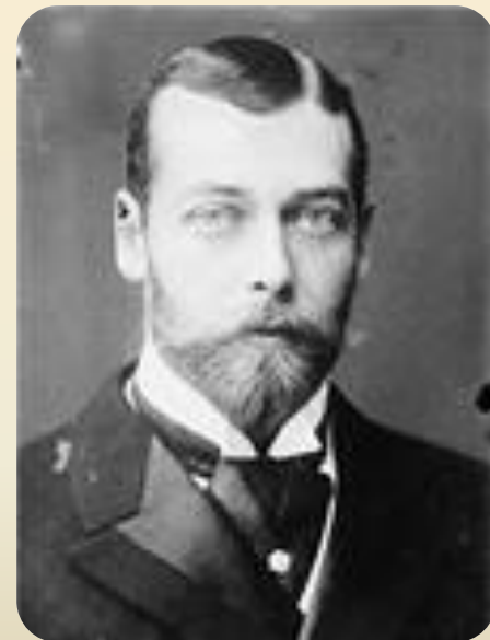
Король Георг V

Англичане установили морскую блокаду Германии. Морская блокада - перекрытие морских путей для всех судов к побережью враждебного государства.