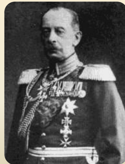
Альфред фон Шлиффен (1833-1913) Начальник германского Генерального штаба

План Шлиффена - молниеносная победа над Францией, до начала активных действий со стороны России.