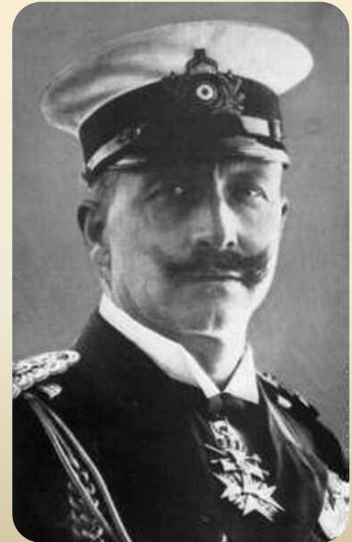
Император Вильгельм II