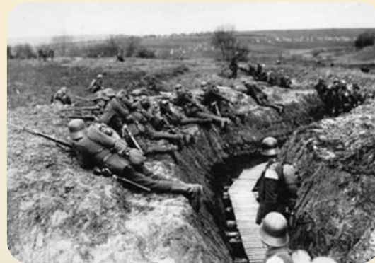
Немецкие войска на позициях