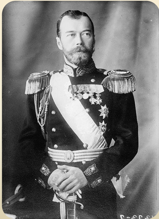
Император Николай II

1 августа (19 июля по ст. ст.) Германия объявила войну России