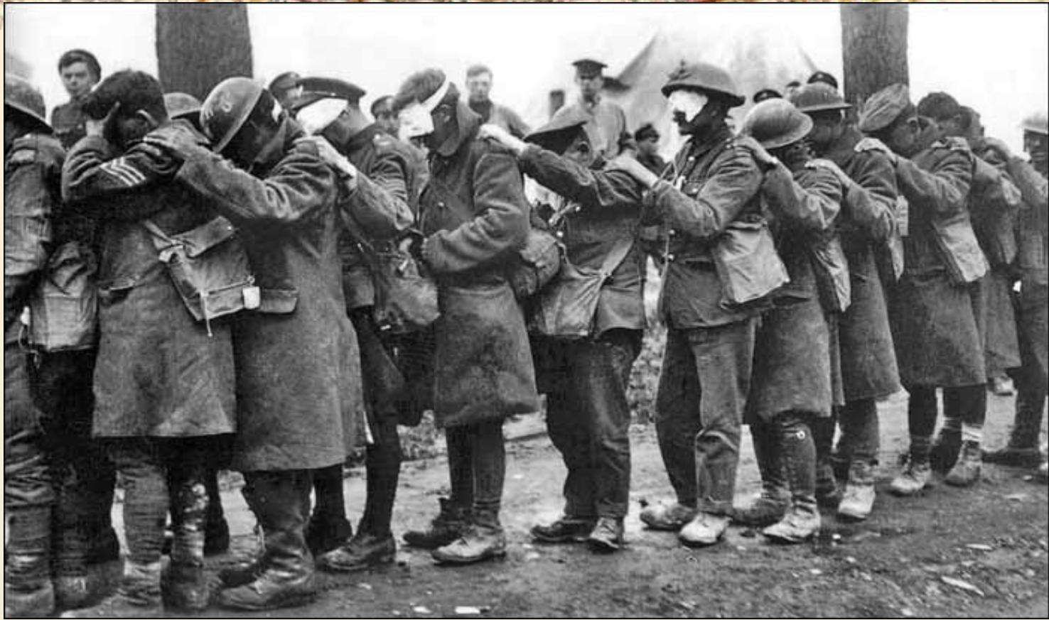
Последствия газовой атаки в районе г. Ипр