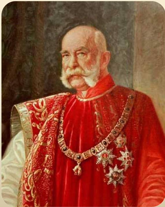
Император Франц Иосиф

28 июля (15 июля по ст.ст.) 1914 года Австро-Венгрия объявила войну Сербии.