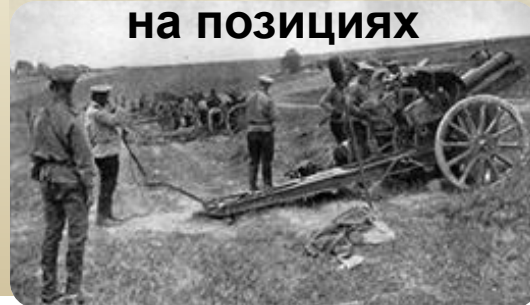
Русские артиллеристы в Галиции