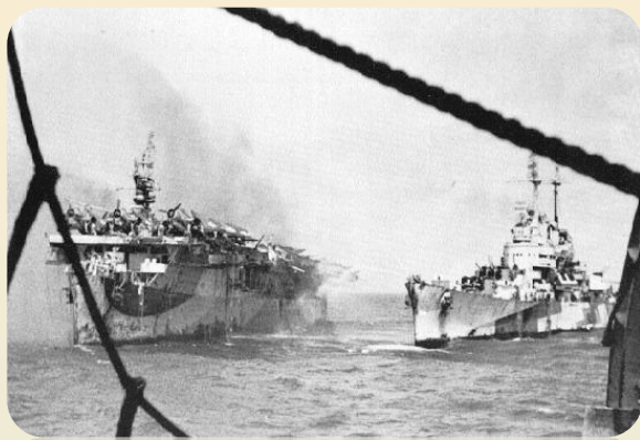
Легкий крейсер «Бримингем» против немецкой ПЛ «U-15»

Англичане установили морскую блокаду Германии. Морская блокада - перекрытие морских путей для всех судов к побережью враждебного государства.