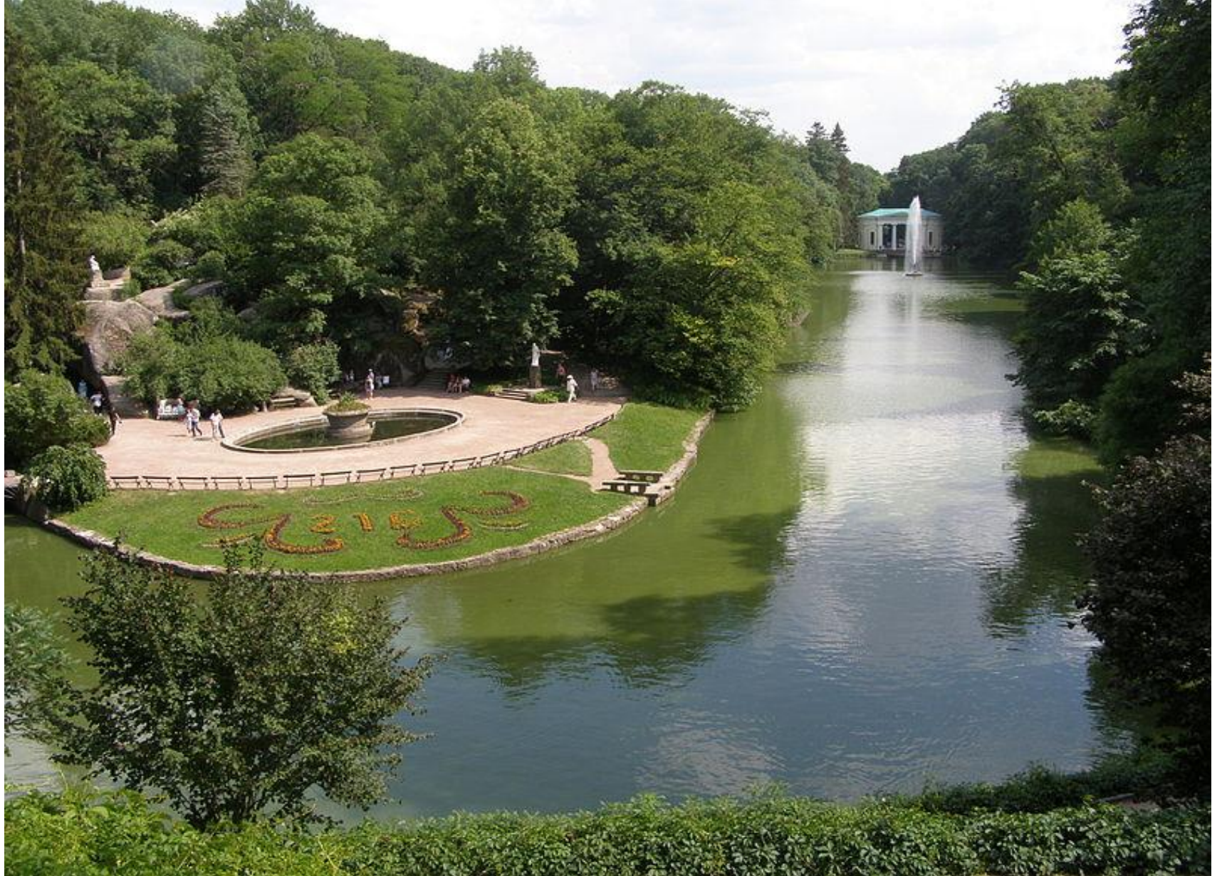
Парк Софиевка в Умани