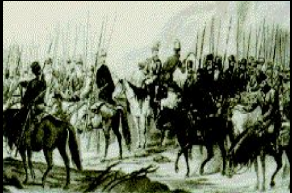
Уральские казаки, примкнувшие к Пугачеву.