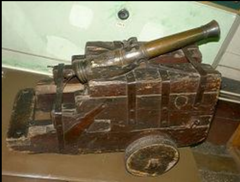
«Пугачёвская пушка» на самодельном лафете (34-мм калибр, бронза, вес 51 кг)

Армия организована по образцу регулярной: