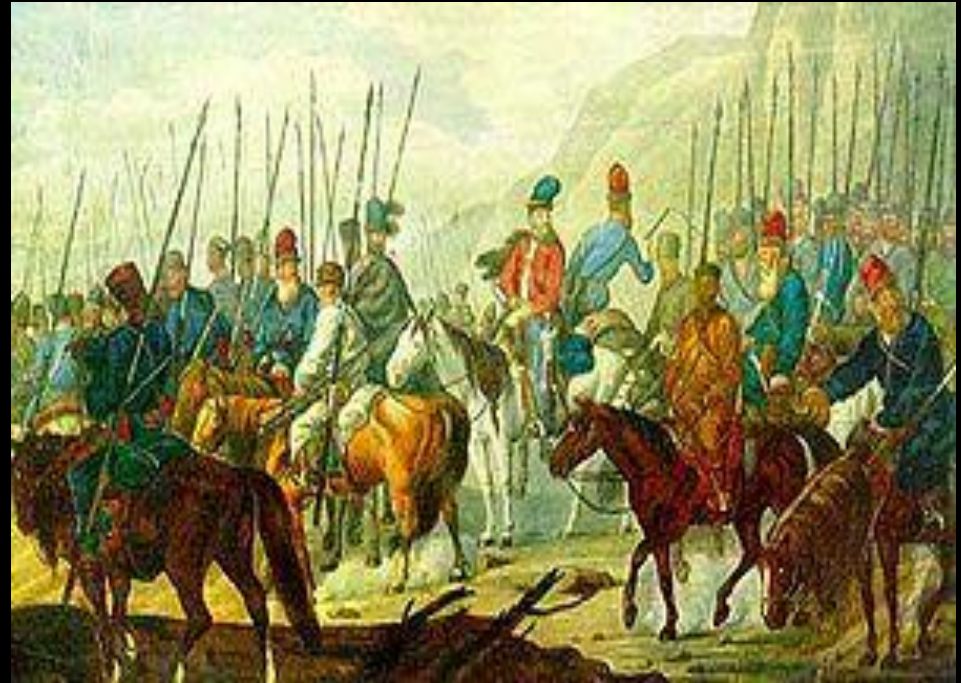
Яицкие казаки в походе. (Аквадель конца XVIII века)