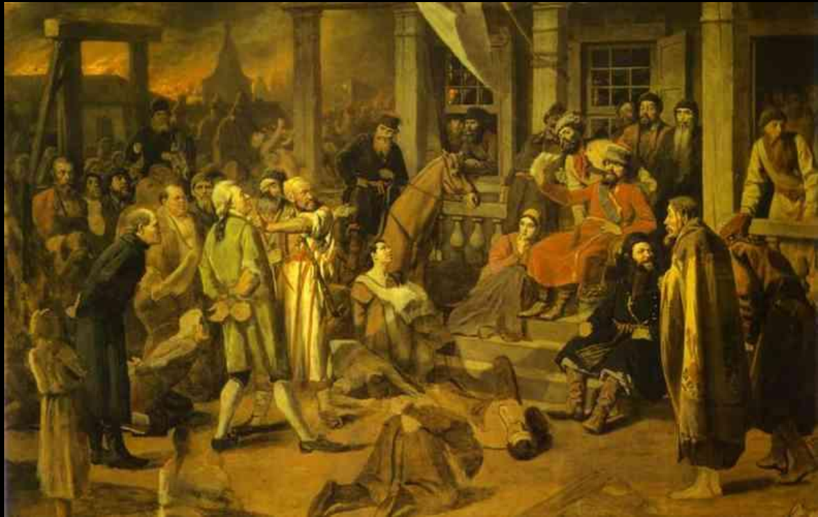
Василий Перов «Суд Пугачёва» (1879)