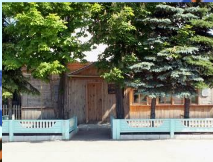
Дом музей в п. Торбеево