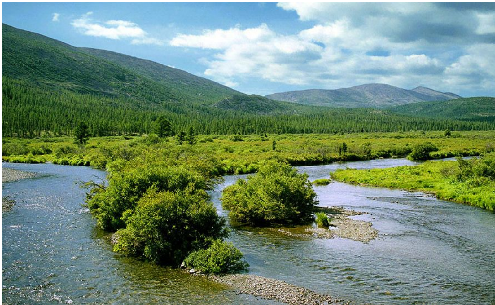
Река Северная Двина