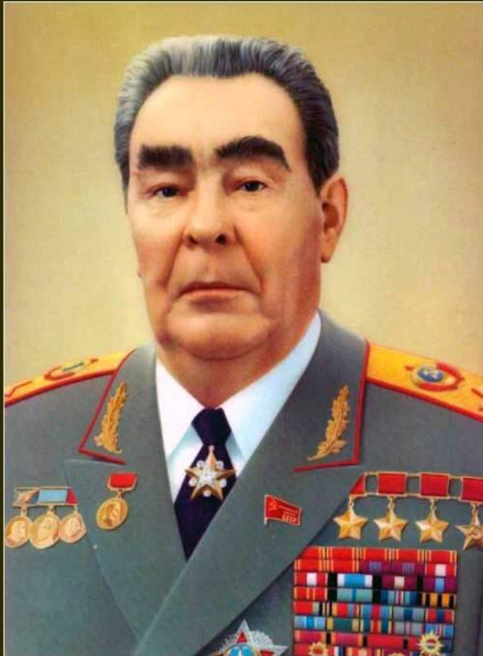
Генеральный секретарь ЦК КПСС.