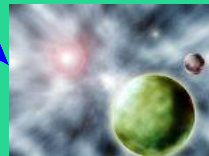
луна, звезды, солнце