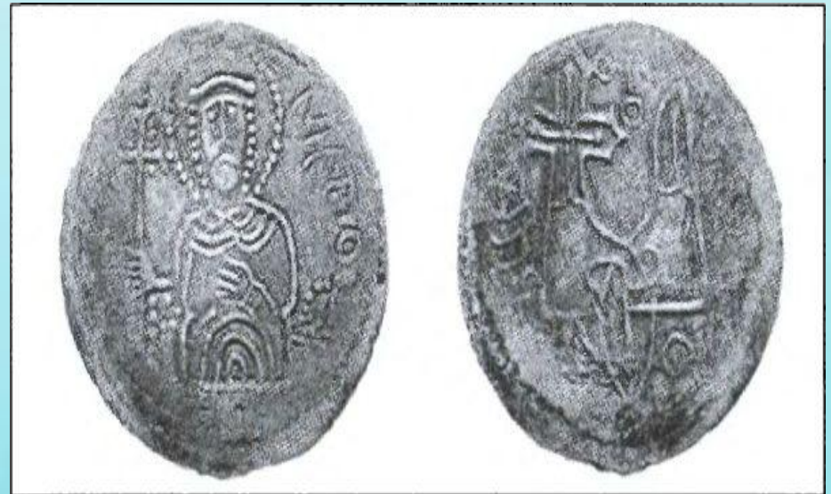
Серебряник Святополка Владимировича