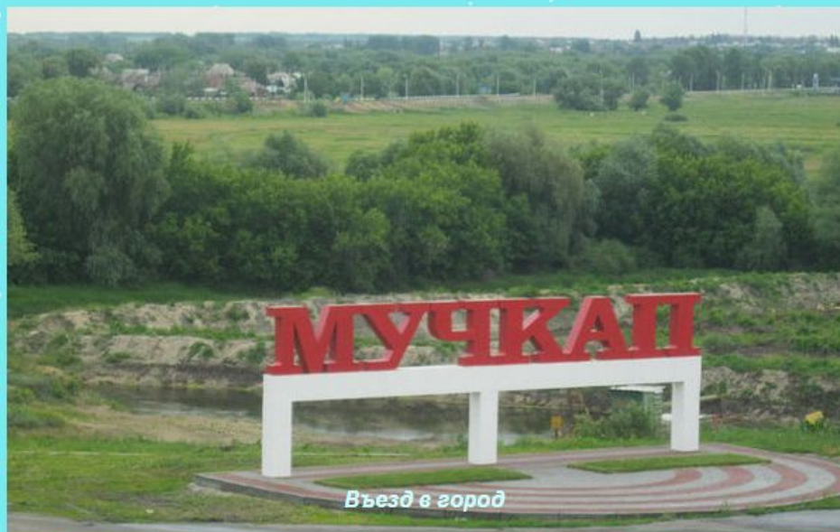
Въезд в город