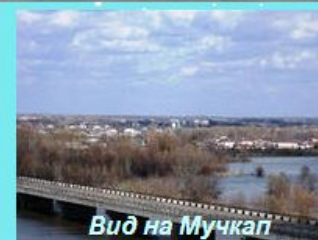
Вид на Мучкап