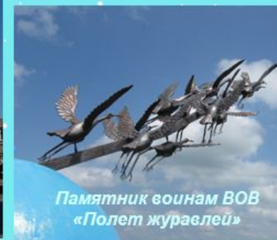
Памятник воинам ВОВ «Полет журавлей»