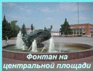
Фонтан на центральной площади