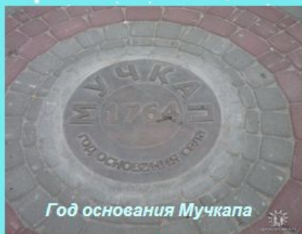
Год основания Мучкапа