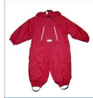
пальто, шуба, теплая куртка, теплый комбинезон.