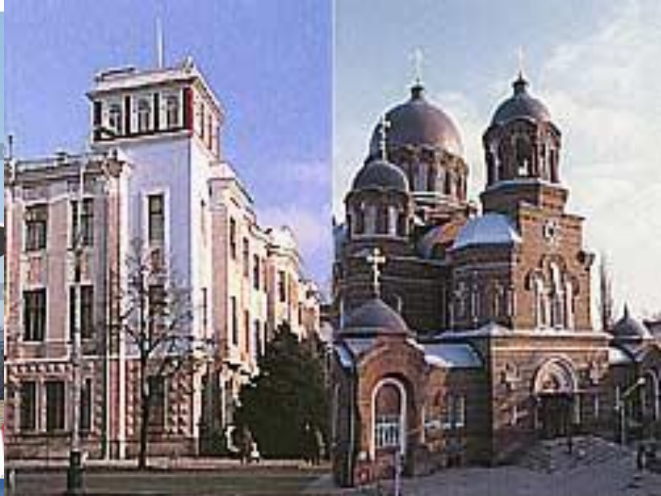
Кинотеатр и памятник Аврора - достопримечательности Краснодара