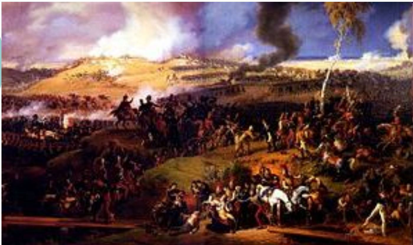
Ф. Глинка о Бородинском сражении