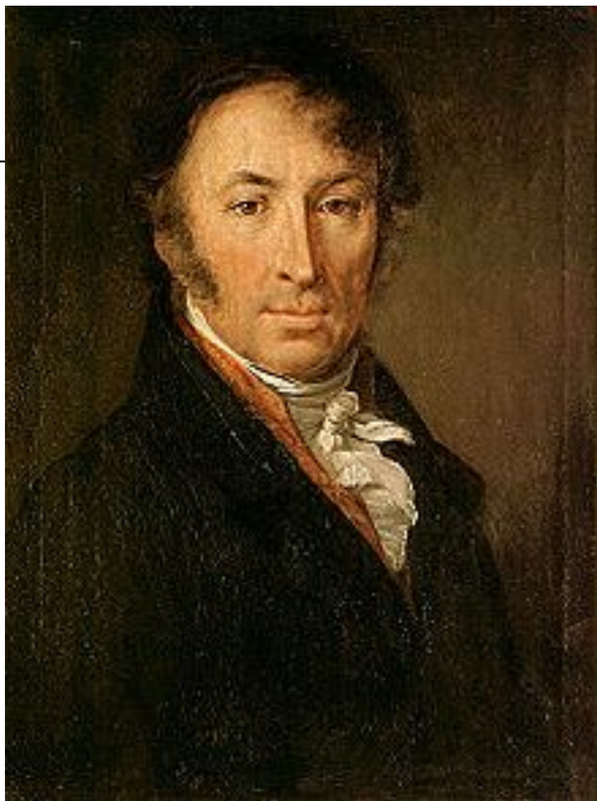
Н. М. Карамзин.