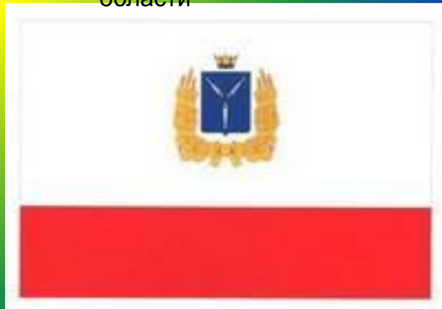
Флаг Саратовской области