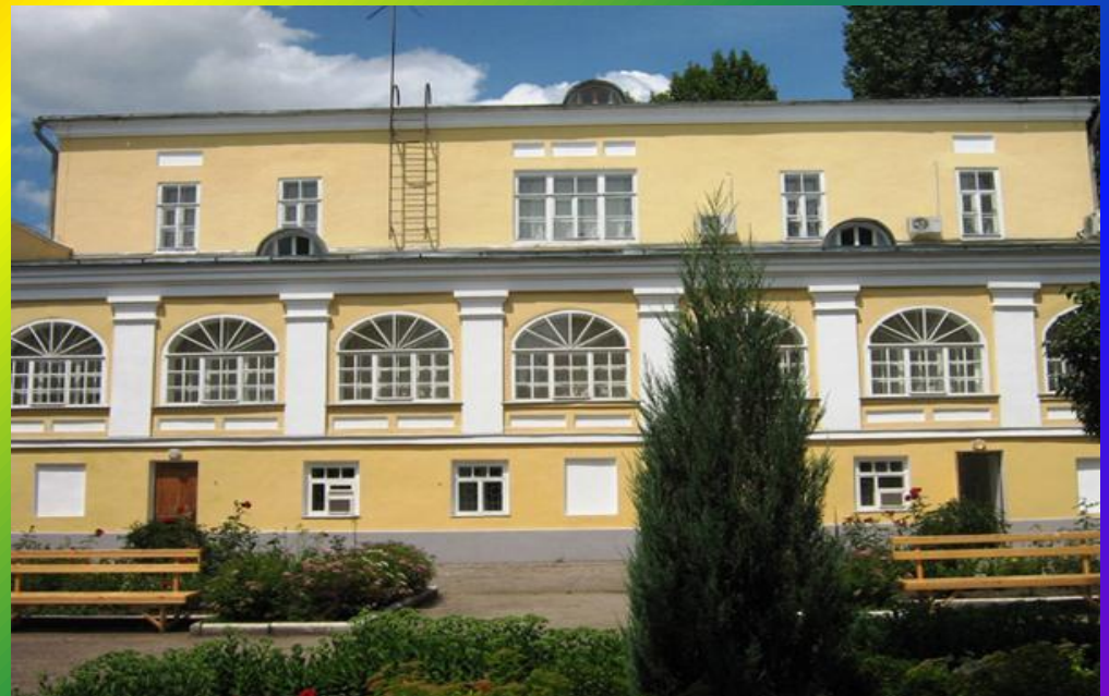
Дом – музей К. Федина