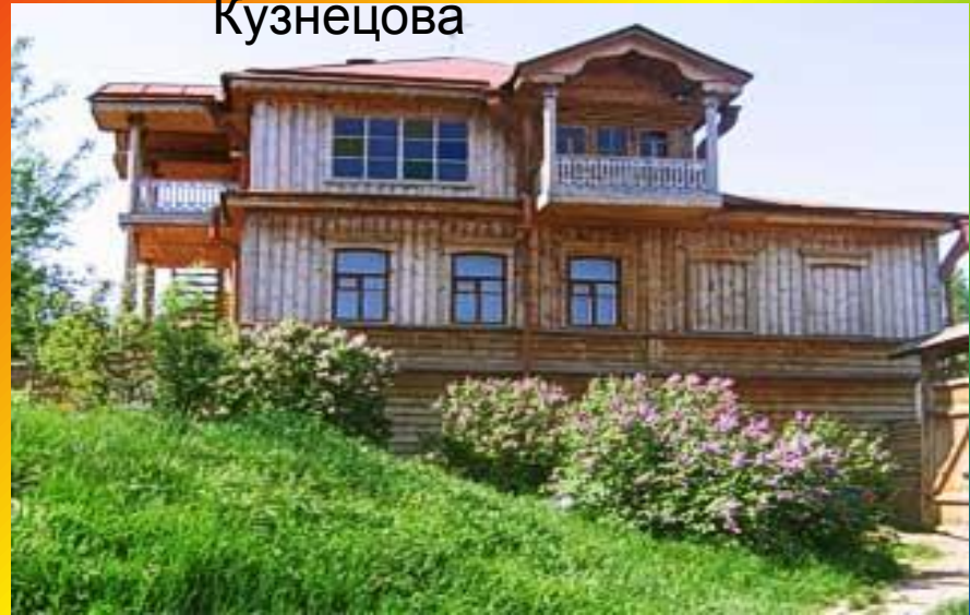
Дом – музей П. Кузнецова