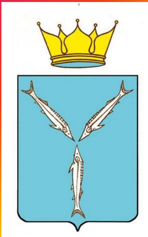
Герб Саратовской области