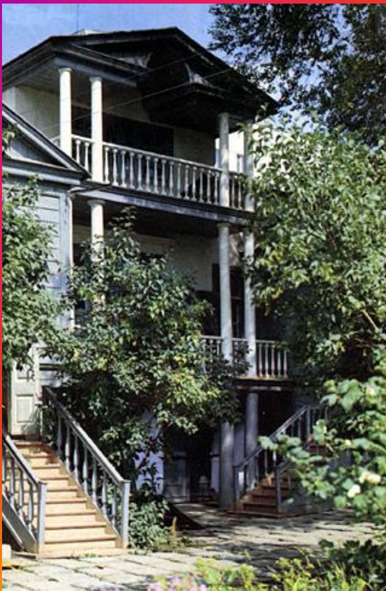
Дом – музей Н.Г. Чернышевского