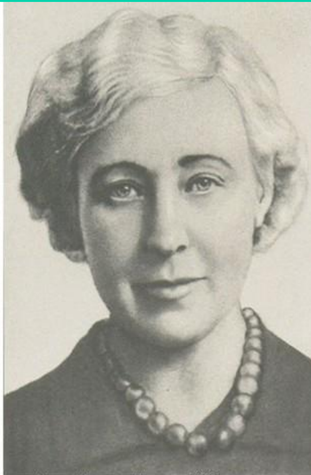
Марина Ивановна Цветаева. 1939г.