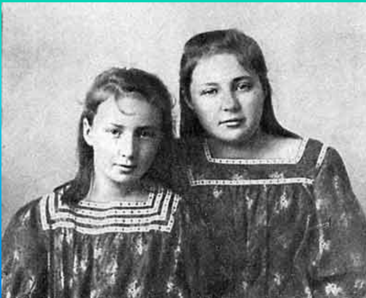
Марина и Анастасия Цветаевы