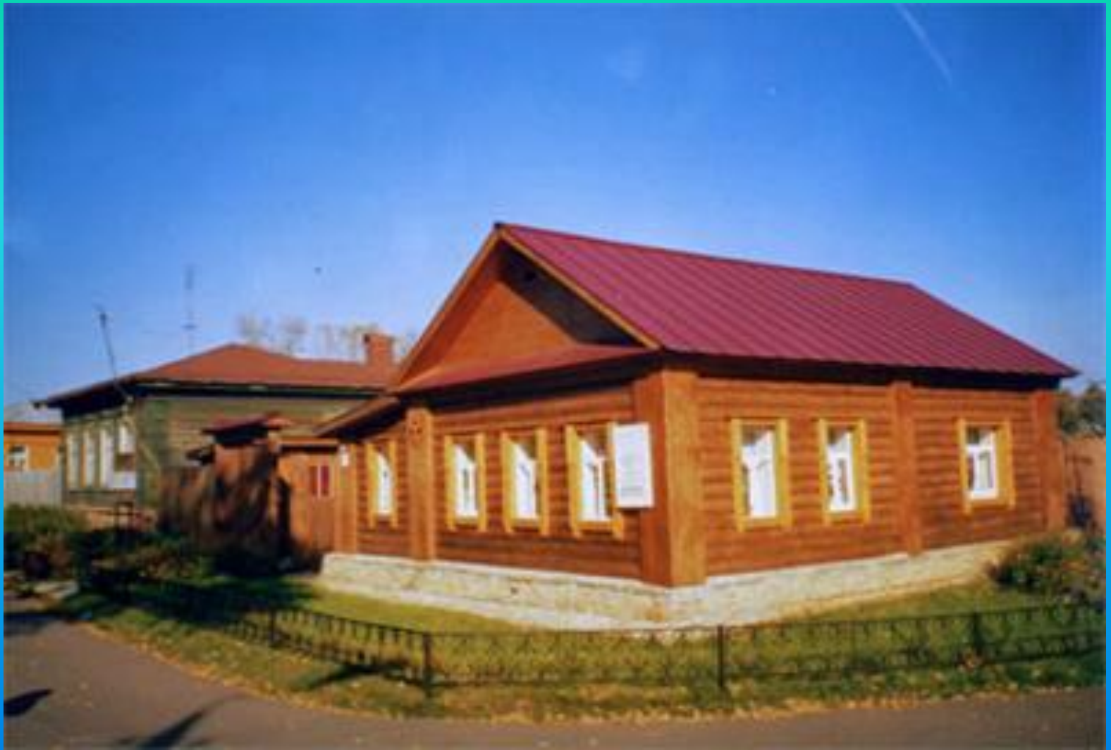
Дом Цветаевой в Елабуге