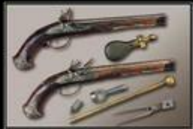
Раньше люди знали, что значит отвечать за свои слова