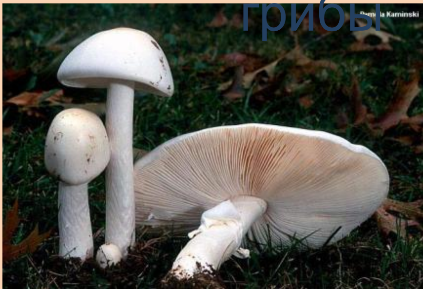
Мухомор вонючий или белая поганка