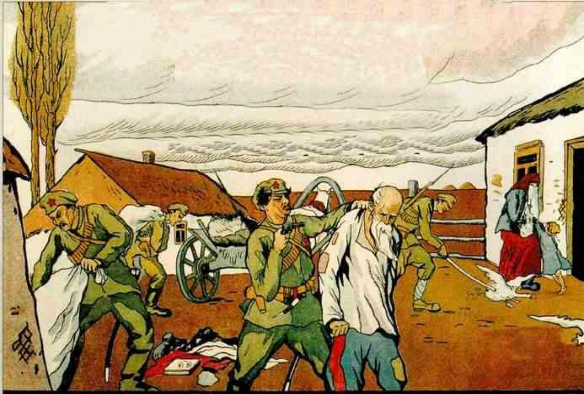
ТАКЪ ХОЗЯЙНИЧАЮТЪ БОЛЬШЕВИКИ ВЪ КАЗАЧЬИХЪ СТАНИЦАХЪ.