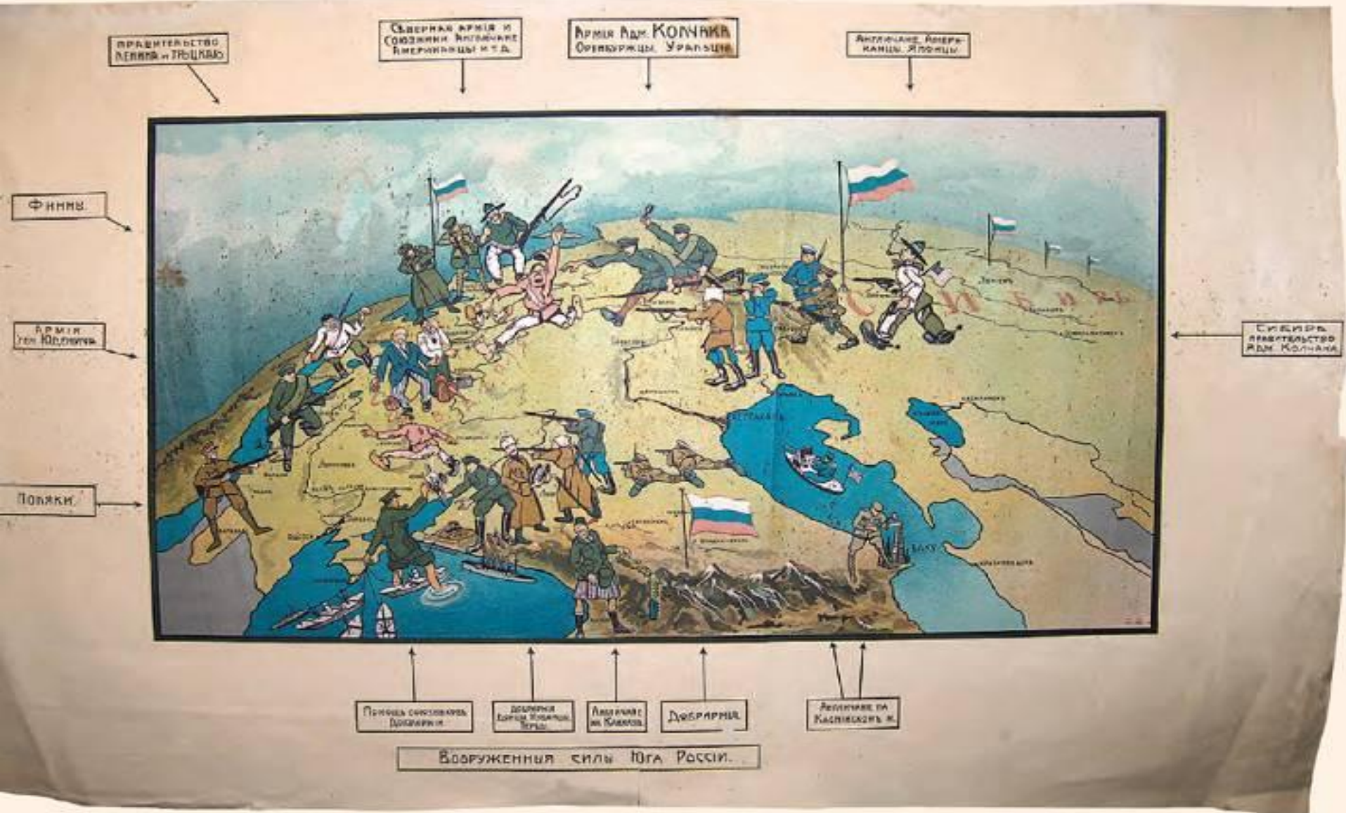
Белогвардейский плакат, изображающий состав антибольшевистских сил. 1919 г.