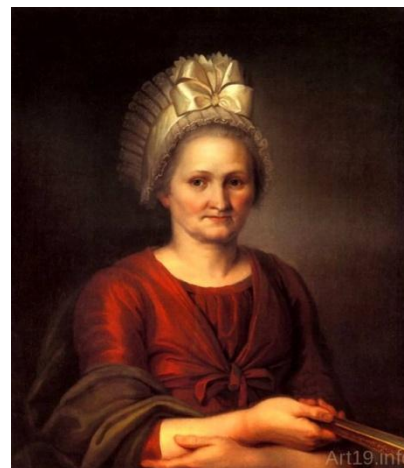
Венецианов « Портрет А.Л Венециановой»