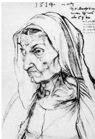
А. Дюрер « Портрет матери (Энн)»