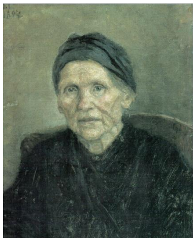
Василий Суриков « Портрет матери»