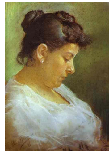
П. Пикассо « Портрет матери художника»,