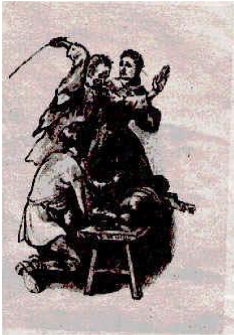
Иллюстрация “Дед порет Алёшу”