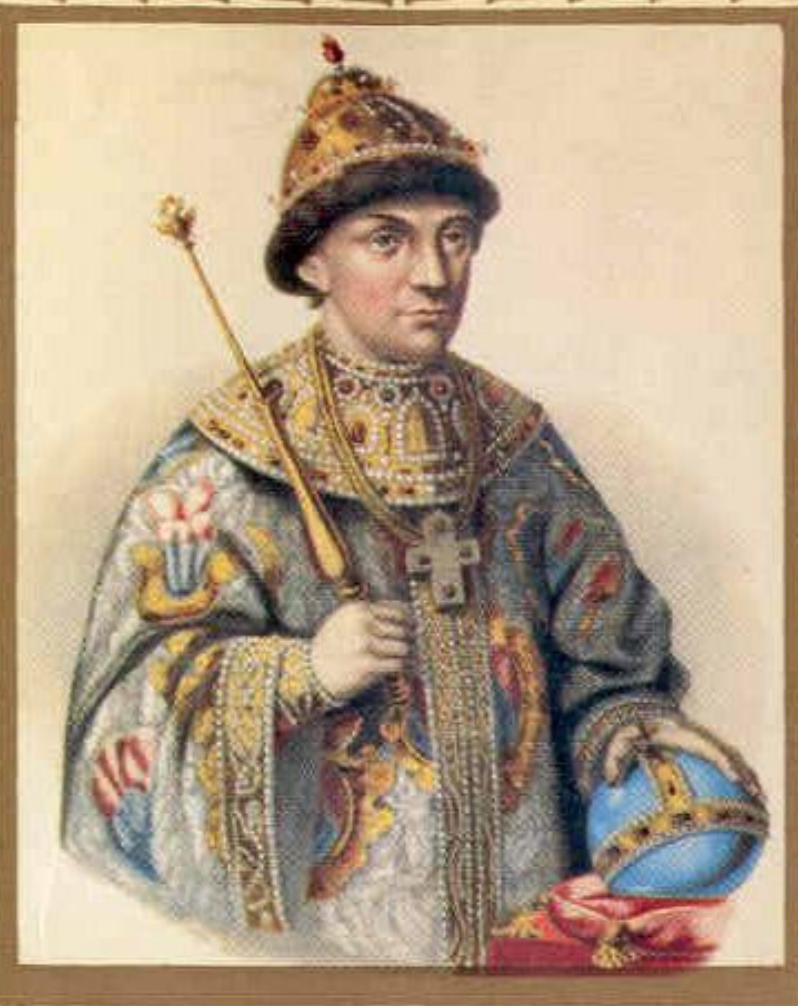
ФЕДОР АЛЕКСЕЕВИЧ (1661—1682) Царь (1676—1682)