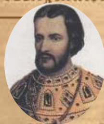
Иоанн V Алексеевич