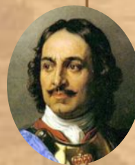
Петр I Алексеевич