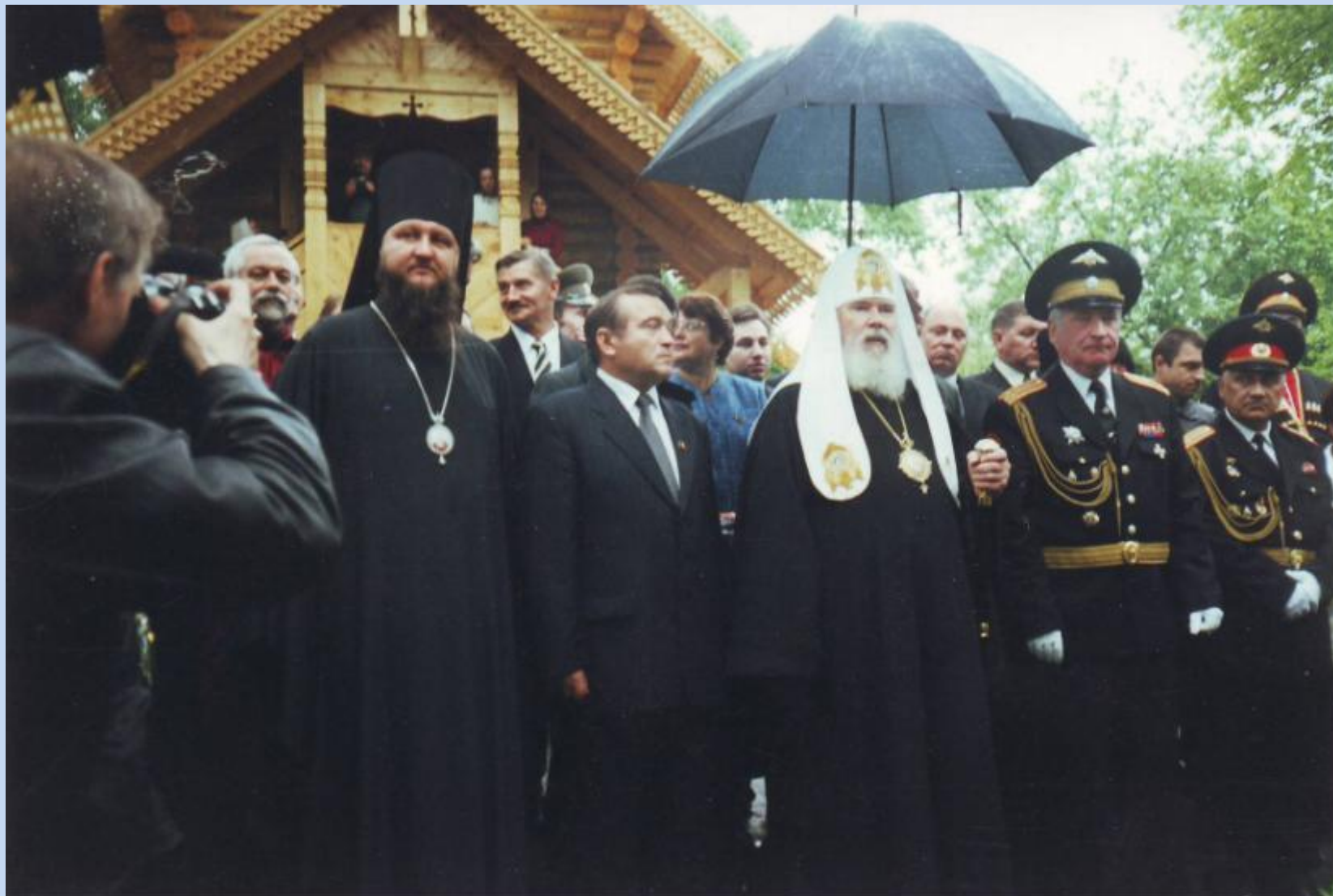
30 мая 2001 года Храм освящен Святейшим Патриархом Московским и всех Руси Алексием II.