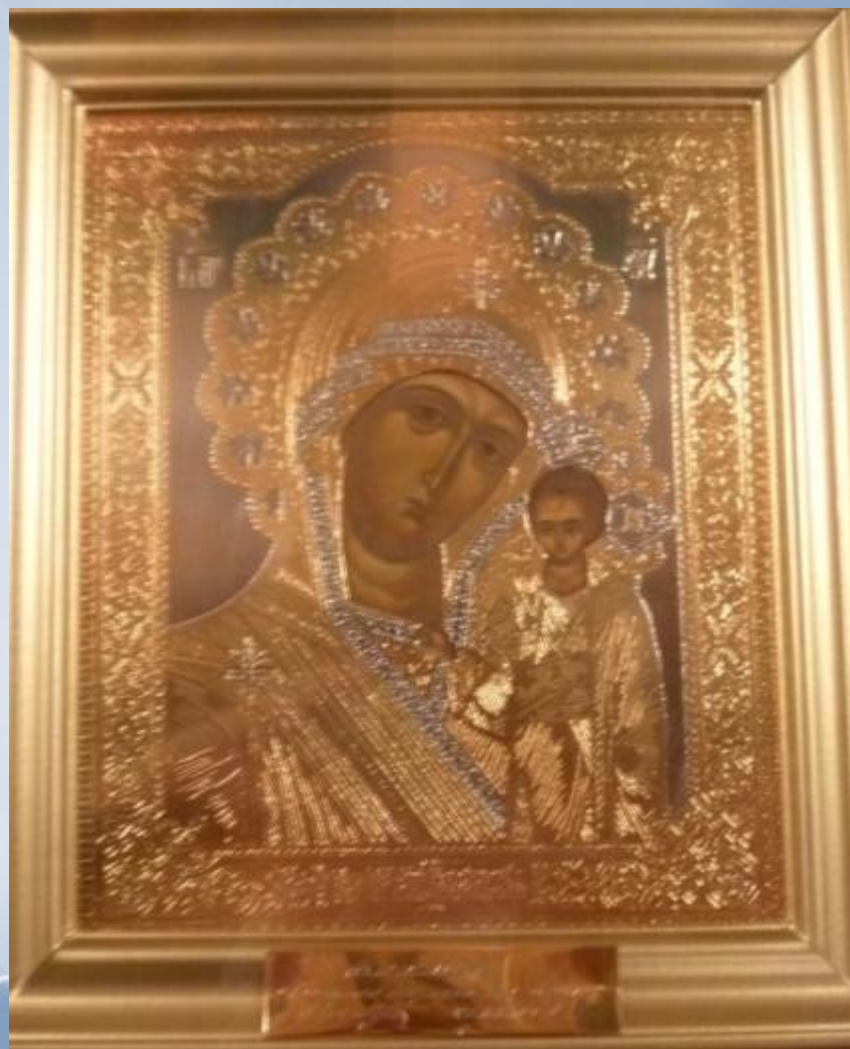
Икона Казанской Божией Матери - благословение Святейшего Патриарха Московского и Всея Руси Алексия II