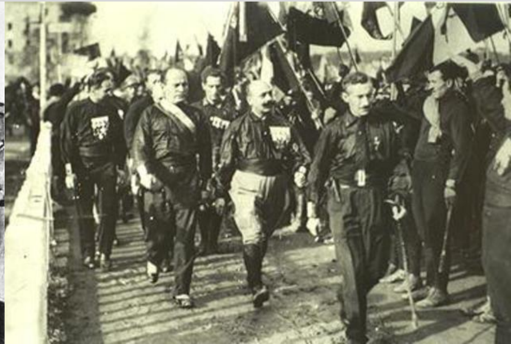
Чернорубашечники в Италии