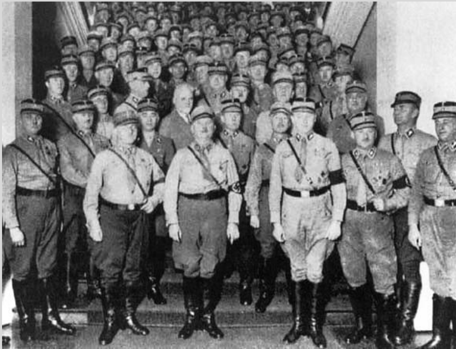
Штурмовики в Германии