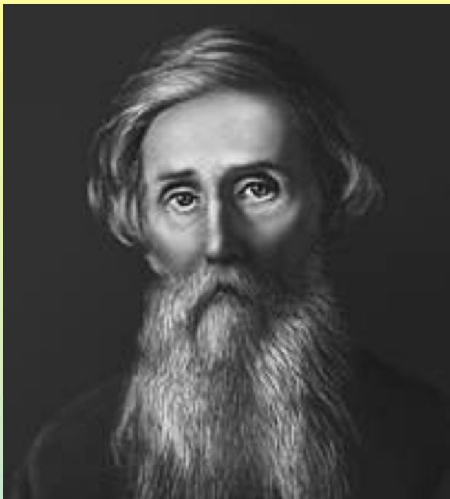
Владимир Иванович Даль