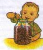
8. ВКУСНОЕ ВАРЕНЬЕ

Губы сомкнуть. Напряжённым языком упираться то в одну щеку, то в другую.