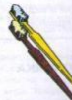
10. ПОЧИСТИМ ЗУБКИ

Рот открыть. Широким кончиком языка, как кисточкой маляра, проводить от верхних резцов до мягкого нёба, производя движения вперёд—назад.