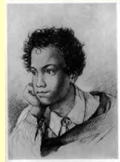
А. С. Пушкин - ученик

Но из всех предметов Саша так и не полюбил арифметику.