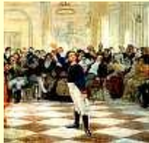
А. С. Пушкин - лицеист