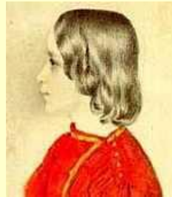
Младший сын, Григорий Александрович Пушкин (1835-1913 г.)