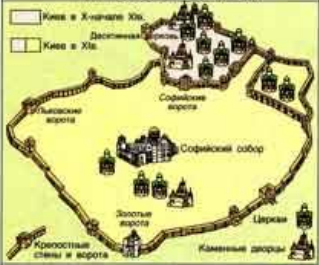
ПЛАН ДРЕВНЕГО КИЕВА