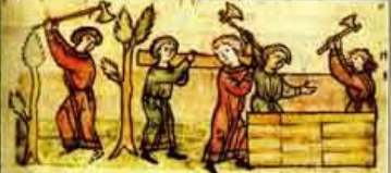
Построение Новгорода ильменскими словенями