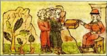
Приношение дани вятичами Святославу