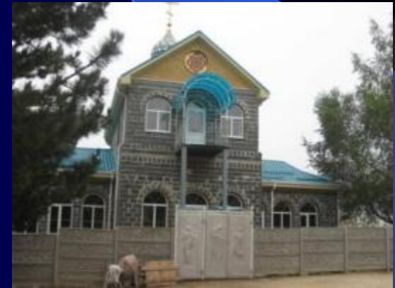
Храм Преподобного Александра – игумена обители неусыпающих