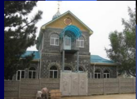
Храм Преподобного Александра – игумена обители неусыпающих