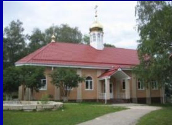
Храм во имя Архистратига Михаила